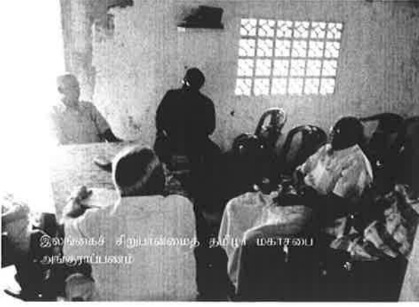
இலங்கைச் சிறுபான்மைத் தமிழர் மகாசபை அங்கூரப்பலம்

சகலவிதமான ஒடுக்குமுறைக்கும் மேம்பாட்டுக்கும் உழைத்து வந்த சி.பா.த. மகாசபை 1980 இல் விடுதலைப்புலிகளால் தடைசெய்யப்பட்டதுடன் மகாசபையினது சகல உடைமைகளும் புலிகளால் அபகரிக்கப்பட்டது. தலித் சமூகத்தின் உரிமைக்காக குரல் கொடுக்க எவரும் அற்ற அநாதைகளாக கிட்டத்தட்ட 30 வருடங்கள் கழிந்து போனது.