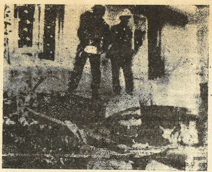
இந்திய ஆக்கிரமிப்புப் படைகள் தமிழ் ஈழமக்களின் வீடுகளை தீயிடும் காட்சி.

இந்திய - இலங்கை ஒப்பந்தம் கையெழுத்தாகும் முன்பு ரே யுந்திய ராணுவத்தின் பிரதானத்து தலைமீட்டைப் பற்றி