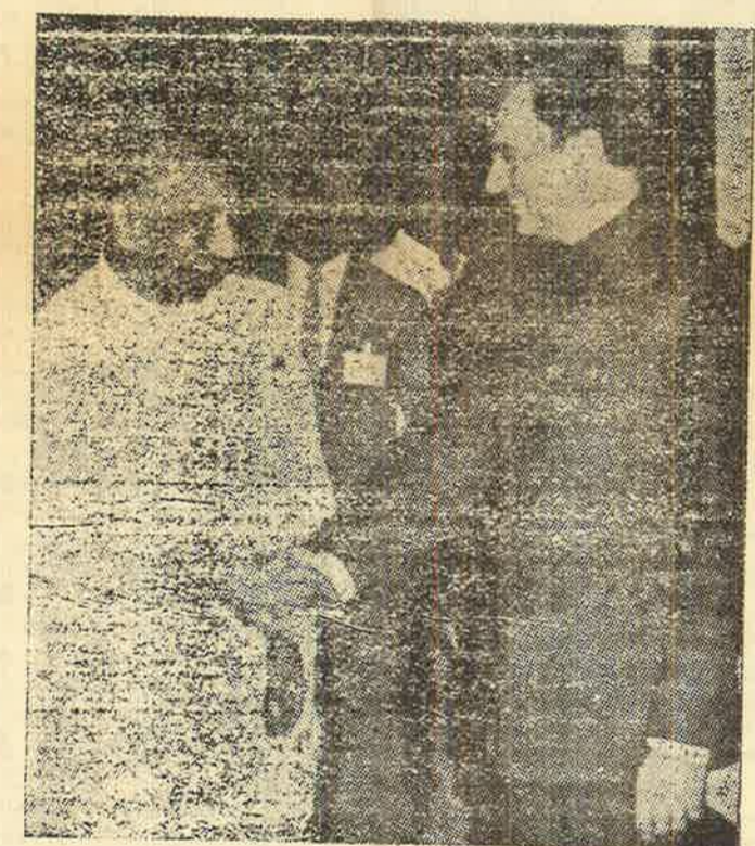
ஜெயவர்த்தனையும் - ராஜீவ் காந்தியும் - ஸ்டீபன் சோலார்ஸ், இவர்களை "தெற்கு ஆசியாவின் பெரினும், சதாத்தும்" என வர்ணித்தார்

1980-ல் வேலை நிறுத்தத்தில் ஈடுபட்டிருந்த தொழிலாளர்களைக் கல்லறைக்கு அனுப்பி விடுவேன் என்று அச்சுறுத்திக்கொண்டு இருந்த ஜெயவர்த்தன அரசு, இன்று தமிழ் விடுதலைப் போராட்டம் என்ற பலமான எதிரியால் ஒருபுறமும் செற்கில் செவிலியர் வேலை நிறுத்தத்தின் மூலம்