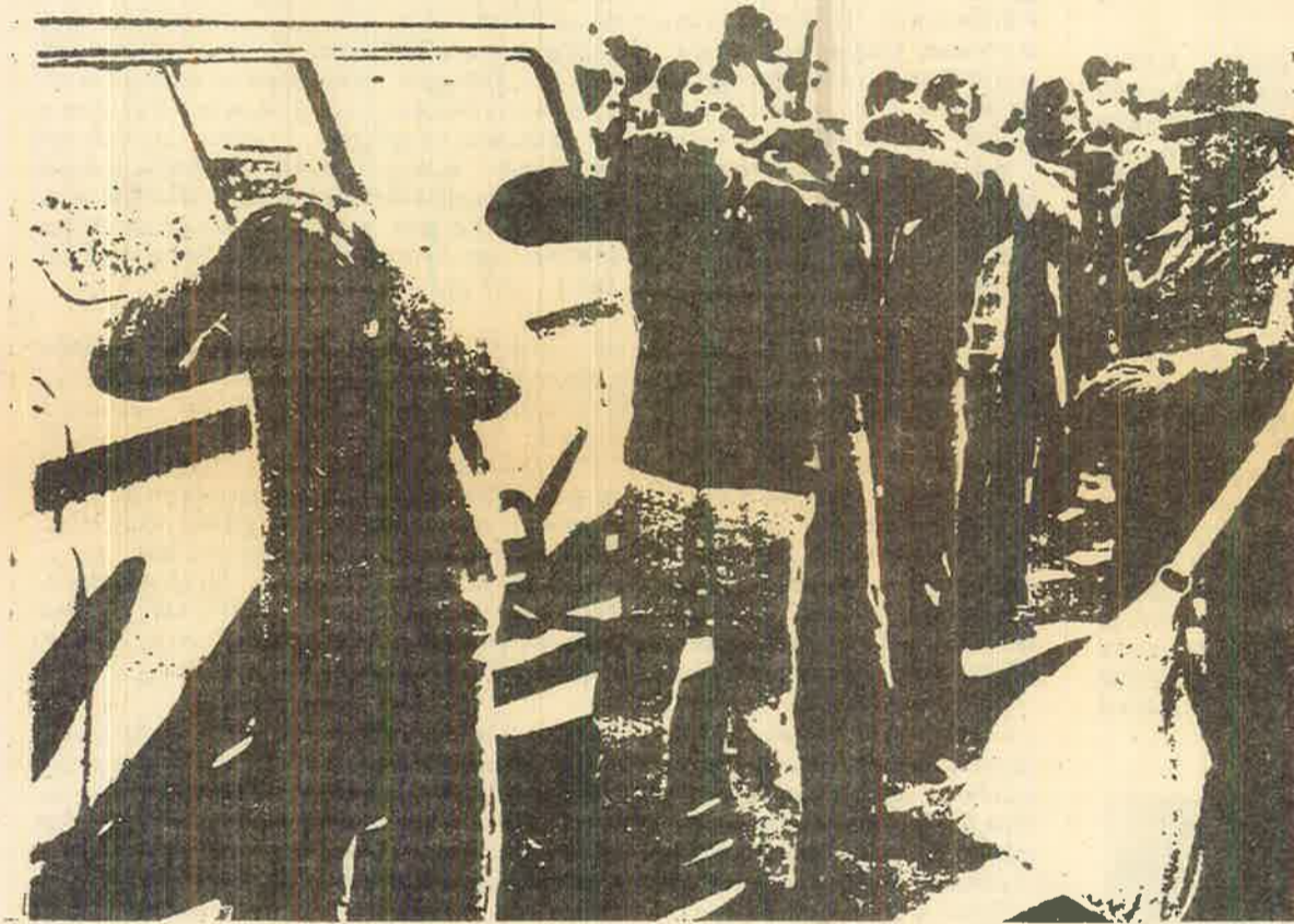
சிலியில் ஆட்சிக் கசிவிழப்புசதி, செப்டம்பர் 1973

82. 1963—ஆம் ஆண்டின் மறு இணைப்பிற்கான மாநாடு, பின் தங்கிய நாடுகளில் நான்காம் அகிலத்தின் பகுதிகளைக் கட்டி எழுப்பும் வரலாற்றுத் தேவையை நிராகரிக்கும் வேலைத் திட்டத்தின் அடிப்படை யாகக் கொண்டிருந்தது. அந்தக் காங்கிரஸில் பப்லோவாதிகளால் நிறைவேற்றப்பட்ட தீர்மானம் பிரகடனம் செய்வதாவது: “மூலாதாரம் வரை அழுதிப்போய், பரந்த மக்களின் ஆதரவினை இழந்துபோயுள்ள ஆளும் வர்க்கங்களால் எதிர்கொண்டுகையில் புரட்சியானது ஏழை விவசாயிகள், திரவாலாகி விட்ட குட்டி முதலாளித்துவ வர்க்கத்தினர் உட்பட பரந்த உழைக்கும் மக்கள் தொகையைப் போராட்டத்தினால் சர்க்கின்றது. இதன்மூலம் பாரம்பரிய ஒழுங்கையும், அதன் அரசையும் சீர்குலைக்கும் கொண்டு வருகிறது. அத்தகைய அழுத்தங்களை இடைநிலைவாத தொழிலாள வர்க்கக்கட்சிகள் மற்றும் அந்த போன்ற அமைப்புக்கள் மீது செலுத்துவதன் மூலம் அவற்றை ஆட்சிக்குக் கொண்டுவரச் செய்கிறது... பின் தங்கிய நாடுகளில் எதிரியின் பலவீனங்கள் மொட்டை ஆயத்ததுடனும் கூட ஆட்சிக்கு வருவதற்கான சாத்தியக்கூறைத் திறந்து விட்டிருக்கிறது.”