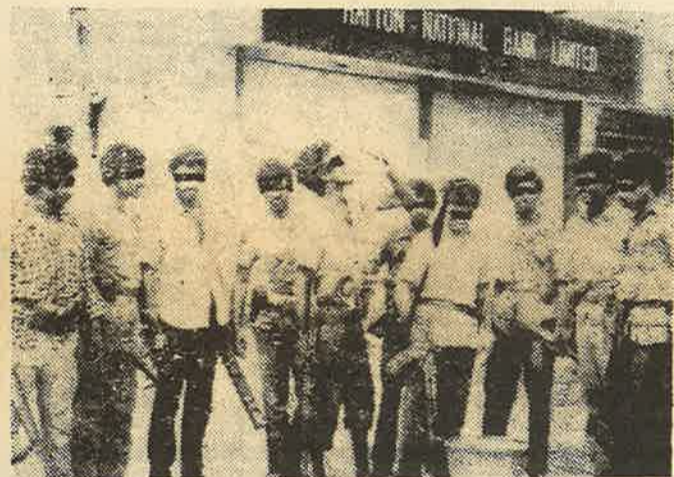
இலங்கையில் தமிழ் விடுதலைப்புலிப் போராளிகள்

97. தொழிலாளர் புரட்சிக் கட்சியின் (WRP) குத்துக்கரணம் நிரூபித்தது போன்று மத்திய கிழக்கில் தொழிலாள வர்க்க நலன்கள் காட்டிக் கொடுக்கப்பட்டமையானது, விடாப்பிடியான முறையில் பிரிட்டனிஸேயே முதலாளித்துவ வர்க்கத்திற்கு சரணாகதி அடைவதற்கு இட்டுச்சென்றது.