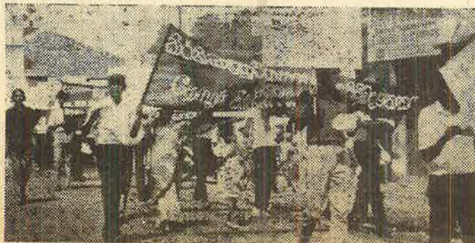
கொழும்பில் புரட்சிக் கம்யூனிஸ்ட் கழகத்தின் மேதின் ஊர்வலம்

அவர் முன்னைய எஸ். எல். எப். பி. மற்றும் யு. என். பி. அரசாங்கங்களினால் ஏற்கனவே தயாரிக்கப்பட்ட அனைத்து தொழிலாள விரோத சட்டங்களையும், விதி முறைகளையும் பயன்படுத்தி உடனடியாக அவரது பின்புறம் தாக்குதலை சம்பாதிக்கப்பட்ட வேண்டும் என்ற அவரது அனைத்துப் பேச்சும். உழைக்கும் மக்களின் அடிப்படை உரிமைகளுக்கு எதிரான மிரட்டும் போர்ப் பிரகடனமாக கருதப்படவேண்டும்.