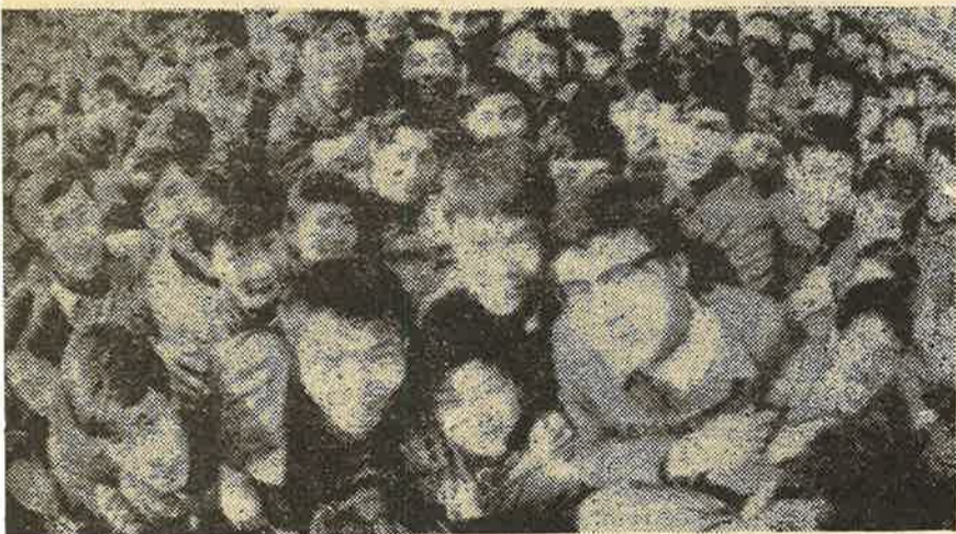
சீனாவில் வேலையில்லாத இளைஞர்கள்—சீன ஸ்டாலினிஸ்டுகள் முதலாளித்துவத்தை வரவேற்கின்றனர்.