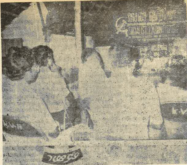
கூட்டத்தின் ஒரு பகுதி