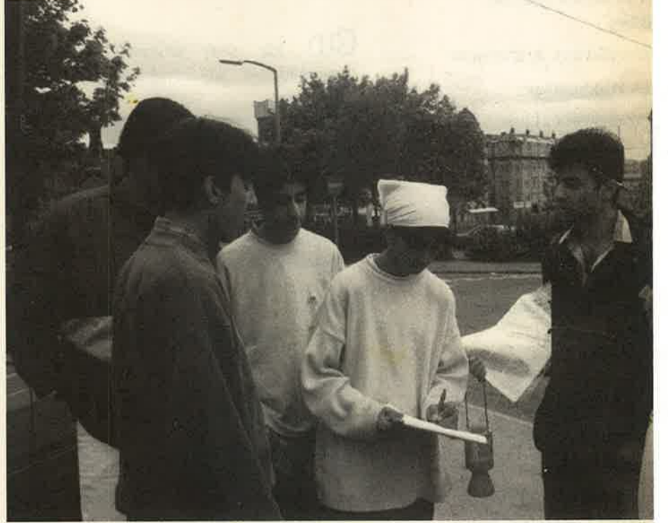
பிரச்சாரம் புலிகளின் தாக்குதலிற்கெதிரான பிரச்சாரம்.

முல்லைத்தீவு இராணுவமுகாமை புலிகள் தாக்கி அழித்ததன் ஒரு கிழமையின் பின்னர் சென்ற ஆடிமாதம் 26ம் திகதியிலிருந்து கிளிநொச்சியைக் கைப்பற்றும் நோக்கில் ஆனையிறவு இராணுவமுகாமிலிருந்து சிரீலங்கா அரசுபடைகளினால் இராணுவ முற்றுகையொன்று மேற்கொள்ளப்படுகின்றது. மக்கள்முன்னணி அரசாங்கத்தின் இந்த புதிய இராணுவ காட்டுமிராண்டித்தனமானது அதனது இனவாத யுத்தத்தின் கொடூரத் தன்மையை இன்னுடைய அடித்தளத்தின் மீது தீவிரமாகக் குகின்றது. யுத்தம் தொடங்கிய சில தினங்களுக்குள் 200,000 ற்கும் மேற்பட்ட மக்கள் கிளிநொச்சிப் பகுதியிலிருந்து அகதிகளாக வெளியே - நியுள்ளனர். இவர்களில் பெரும்பான்மையோர் காடுகளிலும் தெருவோரங்களிலும் தங்கியிருக்கின்றனர். கிளிநொச்சிப் பிரதேசத்தில் அகதிகள் பராமரிப்பு சமூகசேவைகள் போன்ற நடவடிக்கைகளில் ஈடுபட்ட சர்வதேச உதவி நிறுவனங்கள் இந்தப் பிரதேசத்திலிருந்து முற்றாக வெளியேறியுள்ளன. மருத்துவ மனைகள் மூடப்பட்டு நோயாளிகளும் மருத்துவர்களும் அகதிகளாக்கப்பட்டுள்ளனர்.