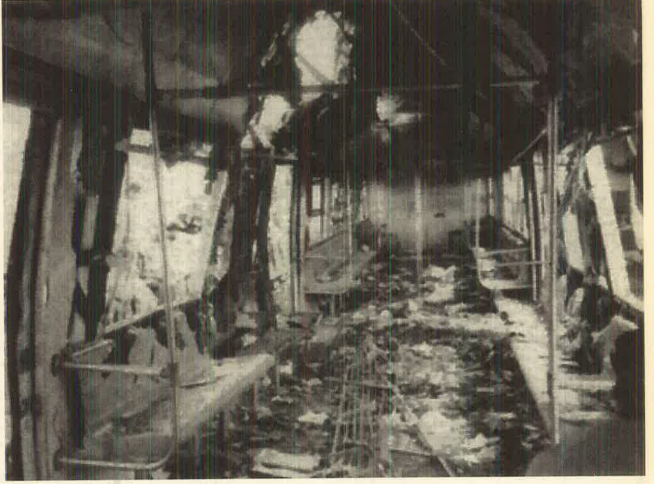
தமிழ் விடுதலைப்புலிகளினால் குண்டுவைத்து தகர்க்கப்பட்ட பயணிகள் ரயில்.

இந்த நிலைமை தமிழ் விடுதலைப்புலிகளை ஏகாதிபத்தியமும் இந்திய இலங்கை முதலாளித்துவமும் என்னவிதத்தில் பாவிப்பது என்பது தொடர்பான சிக்கல்களிலிருந்து உருவாகின்றது. இந்திய உபகண்டத்திலும் இந்துசமுத்திரப் பிரதேசத்திலும் ஏகாதிபத்தியம் வைத்திருக்கும் மூலோபாயமான