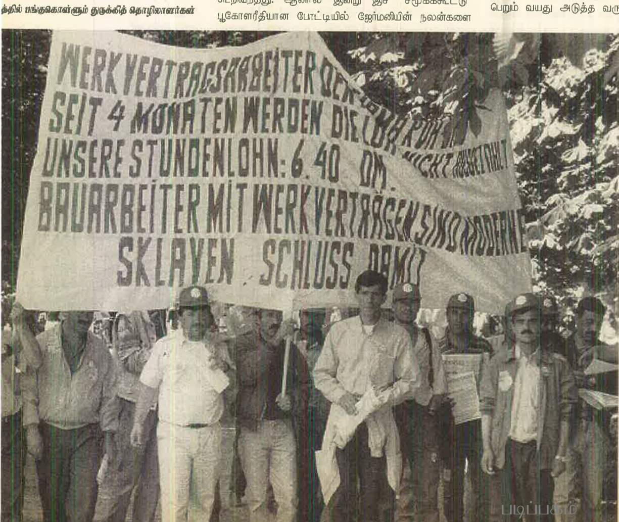
த்தில் பங்குகொள்ளும் குழுக்கித் தொழிலாளர்கள்

இந்த ஊர்வலத்தில் கலந்துகொண்ட சோசலிசத் தொழிலாளர் கழகத்தின் அங்கத்தவர்கள் 10000க்கும் மேற்பட்ட துண்டுபிரசுரங்களை விநியோகித்ததுடன்