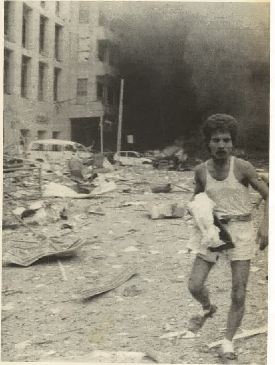
மத்தியவங்கி குண்டு வெடிப்பு

சமசமாள கம்யூனிச இடொ.கா. மலையக மக்கள் முன்னணி போன்ற கட்சிகளின் துணையுடனும் நவ சமசமாளக் கட்சி தொழிற்சங்கத் தலைமைகளின் முண்டுகோலுடனும் பொதுஜன முன்னணி அரசாங்கம் இந்த வேலைத் திட்டத்தை முன்னெடுக்கின்றது. பொதுஜன முன்னணி அரசாங்கத்தினை தனது கருவியாக்கிக் கொண்டுள்ள அமெரிக்க இராஜாங்கத் திணைக்களம் விடுதலைப் புலிகளின் தாக்குதல் இடம் பெற்றதும் அதை கண்டித்து அறிக்கை வெளியிட்டது. இது விபத்துக்கு உள்ளானவர்களையிட்டு அமெரிக்க ஏகாதிபத்தியவாதிகள் கொண்டுள்ள அக்கறையினால் அல்ல. அமெரிக்க ஏகாதிபத்தியவாதிகளின் கையாட்களாக தொழிற்படும் ஆட்சியாளர்களைக் கொண்ட பல்வேறு இடங்களிலும் ஆக்கிரமிப்பு இராணுவம் ஊடுருவிக் கொண்டுள்ளது. ஜரோப்பிய யூனியனும் மற்றும் ஏகாதிபத்திய சக்திகளும் இத்தகைய கண்டன அறிக்கைகளை விடுத்துக்கொண்டு "பயங்கரவாதத்தை" நசுக்கும் சாட்டில் ஊடுருவப் பார்க்கின்றன. இந்த ஏகாதிபத்தியவாதிகள் யுத்தத்தை ஆயுதமாகக் கொண்டு ஒடுக்கப்படும் மக்களை ஒடுக்கித்தள்ளும் பொதுஜன முன்னணி அரசாங்கத்துக்கு ஊக்கமளிக்கின்றன. இது இந்தியத் துணைக் கண்டத்தை காலனியாக்கும் பிற்போக்குத் திட்டத்தின் ஒரு பாகமாகும்.