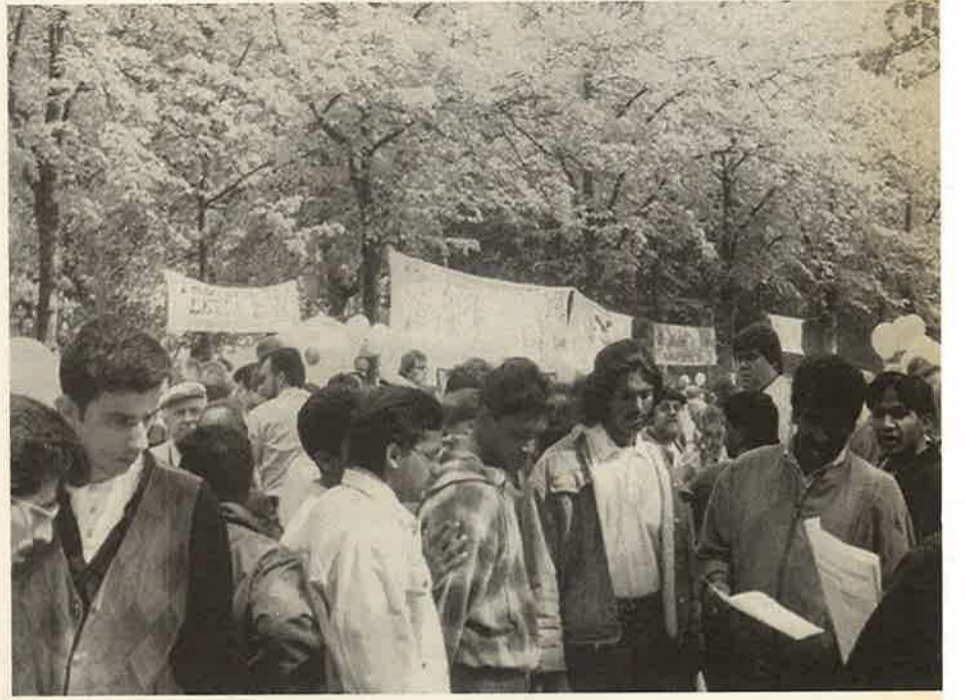
மேதின ஊர்வலத்தில் சோசலிசத் தொழிலாளர் கழகத்தின் மேசையின் முன்னால் தாக்குதலில் ஈடுபட்ட புலிகள்.

இது மிகவும் வெளிப்படையாக தொழிலாள - வர்க்கத்தின் எதிர்ப்பினை அடக்குவதற்காக பாசிச முறைகளுக்குள் அடைக்கலம் புகுவதினை வெளிப்படுத்துகின்றது. யாழ்ப்பாணத்தினை சிறிலங்கா இராணுவம் கைப்பற்றியதுடன் புலிகளினது பிரிவினைவாதக் கொள்கைகள் தமிழ் மக்களை ஒரு முட்டுச் சந்திக்குள் கொண்டுவந்துள்ளது. என்பது அவர்களுக்கு நன்றாகத் தெளிவுபடுத்தப்பட்டுள்ளது. வடக்கின் தமிழ் மக்கள் புலிகளினால் பணயக் கைதிகளாக்கப்பட்டு அகதி முகாம்களிலிருந்து அவர்கள் வெளியேறுவது தடைசெய்யப்பட்டிருப்பதுடன் ஒவ்வொரு எதிர்ப்புகளும் மோசமானமுறையில் அடக்கியொடுக்கப்படுகின்றது. அதேநேரத்தில் புலிகள் ஏகாதிபத்திய சக்திகளை "சமாதான" ஒப்பந்தத்துக்கான தரக்களாக தலையிடுமாறு கோரிக்கை விடுக்கின்றனர். தெற்கில் புலிகள் தனது இராணுவ நடவடிக்கைகளை சிறிலங்கா இராணுவத்திற்கு மேலிடலாமல் பொதுமக்கள் மீது அதாவும் விசேடமாக தொழிலாளர்கள் மீது திருப்பியுள்ளது. இது ஜனவரி 31ம் திகதி கொழும்பு மத்திய வங்கியின் மீது மேற்கொள்ளப்பட்ட தற்கொலைக்