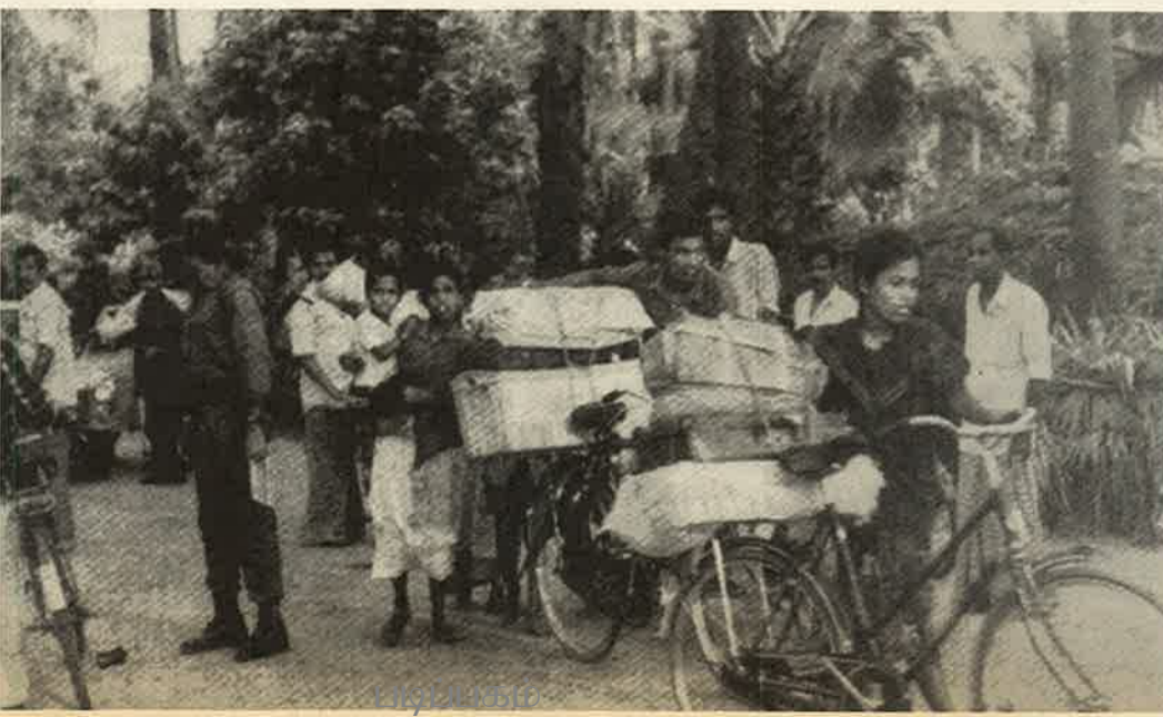
யாழ்ப்பாணக்கிழக்கில் தீர்ப்பி செய்தல் புகளிகள்

தமிழ்-சிங்களம் பேசும் தொழிலாளர் மக்களின் முன்னுள்ள இன்றைய சிறீலங்கா -தமிழீழ சோசலிசக் குடியரசு ஒ அவர்களை ஒன்றிணையச்செய்து போர இந்த யுத்தம் எமது யுத்தம் அல்ல! ஒருசதமோ ஒரு சதமோ ஒரு ஆளே வடக்கு -கிழக்கிலிருந்து இராணுவத்தை எனக் கோருவதன் மூலம் தென் தொழிலாளவர்க்கம் தமிழ் தொழிலாளர் மக்களுடன் சகோதரத்துவத்தை வளர்த்த அவர்களின் பாதுகாப்பை ஊர்ஜிதம் முன்செல்ல வேண்டும். தொழிலாள போராட்டங்கள் வளர்ச்சிபெறும் ஒரு நினை ஒரு சோசலிசப் பதிலீட்டுக்கான தீர்க்கமானது. தொழிலாளவர்க்கம் பதிலீட்டை முன்வைக்கத் த முதலாளிவர்க்கம் இராணுவ சர்வாதிகார