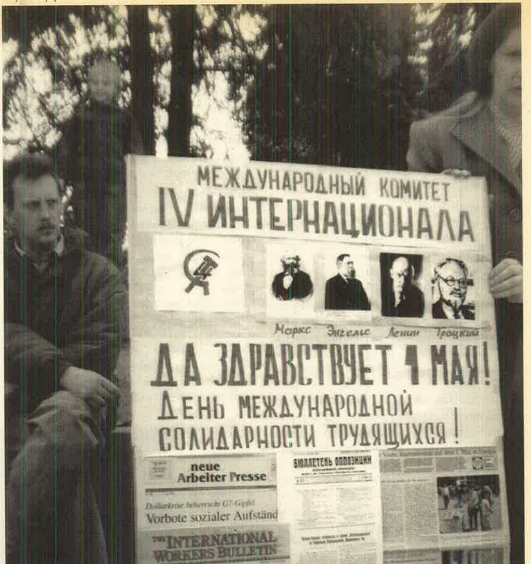
செவியாரிஸ்சின் 1996 மே திசை ஊர்வலத்தில் நான்காம்சிகிலத்தில் ஆதரவாளர்கள்