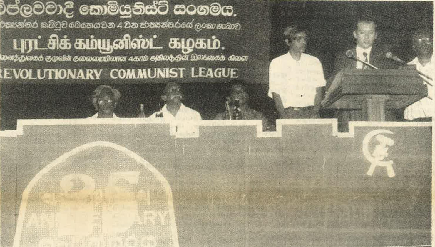
புரட்சிக் கம்யூனிஸ்ட் கழக 25வது ஆண்டு நிறைவு விழா மேடை

நான்காம் அகிலத்தின் அனைத்துலகக் குழுவின் இலங்கைக் கிளையான புரட்சிக் கம்யூனிஸ்ட் கழகத்தின் 25வது ஆண்டு நிறைவு விழா ஜூன் மாதம் 27ம் திகதி அனைத்துலகக் குழு பிரதிநிதிகள் கலந்து கொண்ட சிறப்பு கூட்டம், கண்காட்சி யுடன் கொழும்பு பொது நூலகக் கேட்போர் கூடத்தில் விமரிசையாக கொண்டாடப் பெற்றது. (4-ம் பக்கம் பார்க்கவும்)