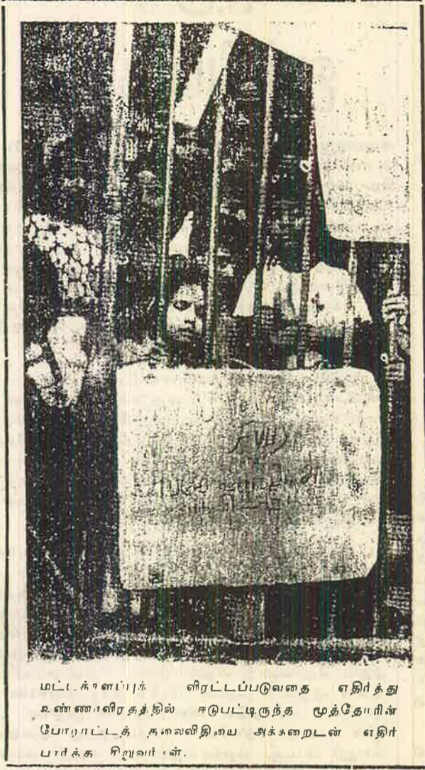
மட்டக்களப்பு விரட்டப்படுவதை எதிர்த்து உண்ணாவிரதத்தில் ஈடுபட்டிருந்த முத்தேரின் போராட்டத் தலைவரின் அக்கறைடன் எதிர் பார்த்த நிராகரிப்பர்.

ஜூன் கடைப்பகுதியில் கொழும்பு அகதி முகாம்களில் தங்கியிருந்த தமிழ் தேசிய இனத்தினரை நிறுக்கு மாகாணத்துக்கு அப்புறப்படுத்தும் இனவாத தாக்குதலை ஆரம்பித்ததோடு, கொழும்பு மாவட்டத்தில் தமிழ் தேசிய இனத்தினருக்கு எதிரான விஜேதுங்க அரசாங்கத்தின் இனவாத தாக்குதல் புதிய கட்டத்தினை எட்டியுள்ளது.