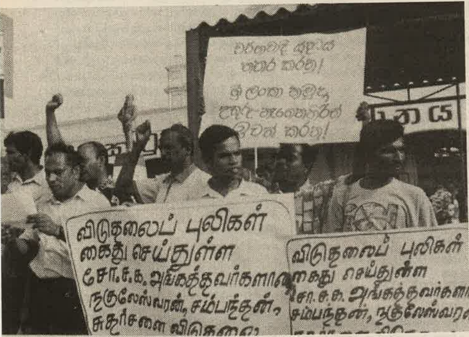
7. ச.க. அங்கத்தினர்களை விடுதலைப் புலிகள் விடுதலை செய்ய வேண்டும் எனக் கோரி கட்சி ரூம்பு கோட்டை புகையிரத நிலையத்தின் எதிரில் நடாத்திய மறியல் போராட்டம்