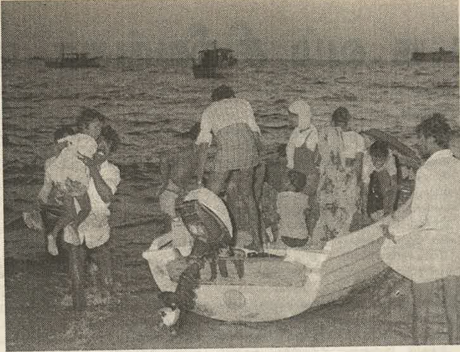
இனவாத பேரழிவில் இருந்து தப்ப இராமேஸ்வரத்தில் தரையிறங்கும் தமிழ் அகதிகள்

ஏகாதிபத்தியவாதிகளுடன் "சமாதான சகவாழ்வு" விதிமுறையுடன் இணைந்து கொண்ட சோவியத் ஸ்டாலினிச அபிதாரத்துவத்தை மையமாகக் கொண்டு ஸ்டாலினிஸ்டுகளின் முண்டு கோவில் நின்று கொண்டிருந்த இந்திரா காந்தி காங்கிரசும் சிரிமா பண்டாரநாயக்கின் கூட்டரசாங்கமும் அமெரிக்க ஏகாதிபத்தியவாதத்துக்கு எதிராக தென்ஆசியாவில் ஒரு காப்பரண் அமைத்துக் கொண்டு இருந்தது என்ற உளறல்களிலும் இந்த மக்கள் முன்னணிக்காரர்கள் ஈடுபட்டிருந்தனர். இலங்கை இந்திய ஆட்சியாளர்கள் சோவியத் யூனியனுடன் கொண்டிருந்த சந்தர்ப்பவாத உறவுகளை உலக வல்லரசு என்ற முறையில் அமெரிக்க ஏகாதிபத்தியவாதிகள் சகித்துக் கொள்ளவில்லை என்பது உண்மை. ஆனால் அதைச் சாட்டாகக் கொண்டு இலங்கையிலும் இந்தியாவிலும் முதலாளித்துவ ஆட்சியாளர்களுக்கு ஏகாதிபத்தியத்தில் இருந்து சுதந்திரமான அரசியல் விதிமுறை இருந்ததாகக் கூறுவது முற்றிலும் அர்த்தமற்றது.