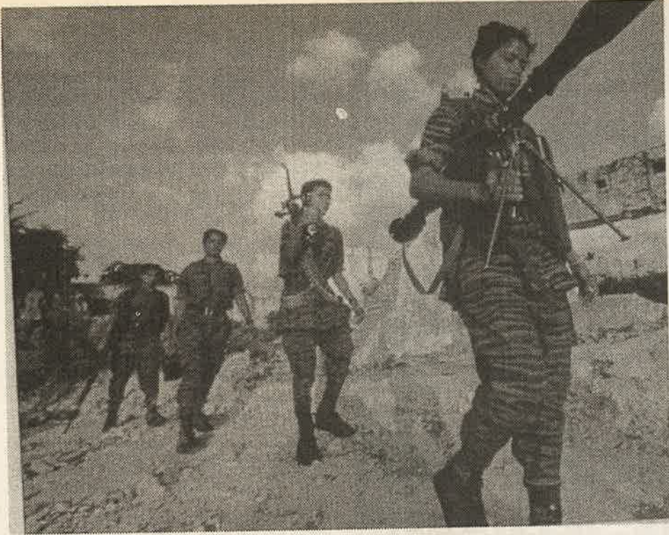
தமிழீழ விடுதலைப் புலிகளின் மகளிர்

படையணி அல்லாதவர்களுக்கு எதிரான முழு அளவிலான வன்முறைகளும் தமிழ்ப் பேசும் முஸ்லீம்களையும் கிறிஸ்தவர்களையும் அன்னியப்படுத்தி உள்ளதோடு பெருமளவுக்கு முஸ்லீம்களைக் கொண்ட கிழக்கு மாகாணத்தில் இன்று பொதுஜன முன்னணியுடன் சேர்ந்து கொண்டுள்ள ஒரு முதலாளித்துவ பிரிவினைக் கட்சி தோன்றவும் எண்ணெய் வார்த்துள்ளது. அது முஸ்லீம்களுக்கென தனியரசு நிறுவப்பட வேண்டும் எனக் கோருகின்றது. யாழ்ப்பாணத்தில் முஸ்லீம்களும் சிங்களம் பேசும் மக்களும் சிறீலங்கா இராணுவத்தில் மட்டுமே எஞ்சியுள்ளனர். தமிழீழ விடுதலைப் புலிகள் அதனது தமிழ் அரசைக் கூறுபோட்டுக் கொள்வதில் வெற்றிகாணுமானால் சிங்கள சோவியலிஸ்டுகள் தமது புறத்தில் தெற்கில் உள்ள தமிழர்கள் மீது நாற்றம் எடுக்கும் பழிக்குப்பழி வாங்கும் நடவடிக்கைகளில் ஈடுபடுவர். அவர்களை சிறீலங்கா முதலாளி வர்க்கத்தின் யுத்தக் கொள்கையின் வீழ்ச்சியின் பலிகடாக்களாக்குவர்.