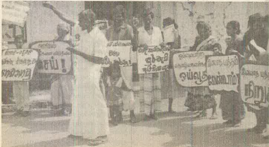
சோ.ச.க. பண்டாரவளை அங்கத்தவர் உரையாற்று கின்றார்.

நாட்டின் மத்தியில் தோட்டத் துறையில் வாழும் முழுக் குடும்பங்களின் எண்ணிக்கை 4 இலட்சம் எனக் கணக்கிடப்பட்டுள்ளது. அவர்களில் 98 வீதமானவர்கள் வசிப்பது, பல தசாப்தங்களுக்கு முன்னதாக அமைக்கப்பட்ட 16 x 8 அல்லது 12 x 16 லைன் அறைகளிலாகும். சம்பகால புள்ளி விபரங்களின்படி தோட்டத் துறையில் இப்போது இருந்து கொண்டுள்ள முழுவசிப்பிடங்களின் எண்ணிக்கை வருமாறு: ஒற்றை லைன் அறைகள்..... 104556 இரட்டை லைன் அறைகள்..... 108825 தற்காலிக குடிசைகள்..... 22410 குடிசைகள்..... 30600 தற்காலிக வீடுகள்..... 35100 இவற்றில் ஓரளவுக்கேனும் மனித ஜீவியத்துக்கு ஏற்றவை எனக் கூறக் கூடியது 20 ஆண்டுகளுக்கு முன்னர் கட்டப்பட்ட இரட்டை வீடுகளாகும். சிங்களக் கிராமங்களில் இருந்துவரும் சுமார் 35100 குடும்பங்கள் வாழ்வது தோட்டங்களுக்கு அண்மித்தாக உள்ள கீழ் டிவிசன்களில் அமைத்துக் கொண்ட வீடுகளிலாகும். தோட்டங்களில் தொழிலாளர்களும் இளைஞர்களும் முகம் கொடுக்கும் பிரமாண்டமான பிரச்சினை வேலையின்மை. தோட்டத் தனியார்மயத்துக்கு முன்பு இளைஞர்களுக்கு தோட்டங்களில் தொழில்