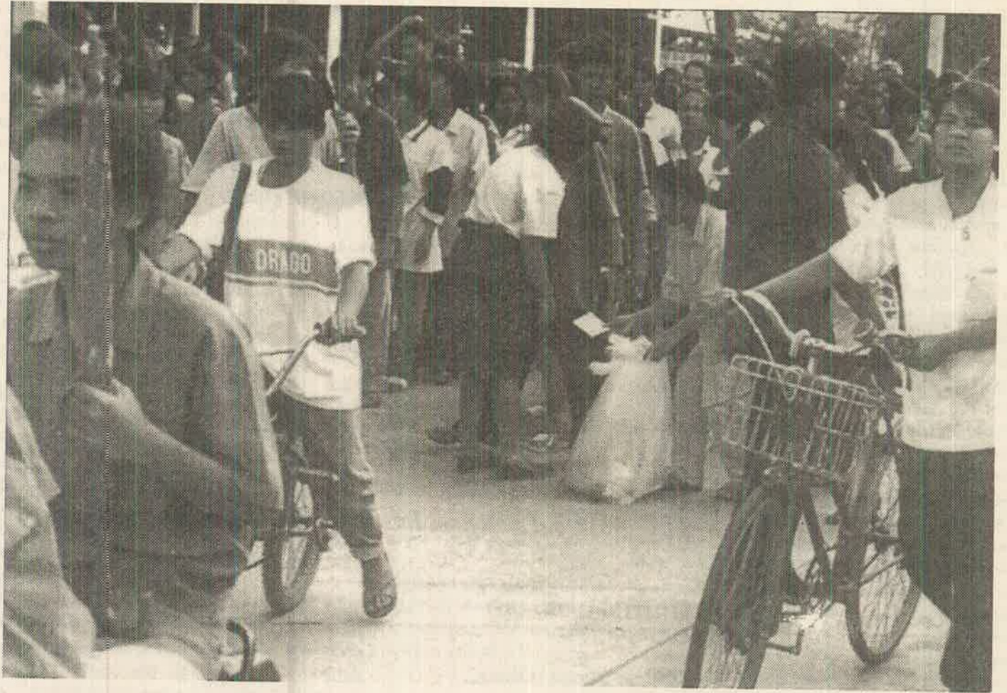
தாய்லாந்து டைனமிக் விளையாட்டு பொருள் பட்டியின் நுழையும் இளம் தொழிலாளர்

1920பதுகளும் 1930பதுகளும் ஒரு புறத்தில் உலக முதலாளித்துவ அமைப்பின்