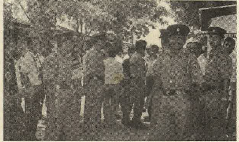
மத்திய தபால் பரிவர்த்தனை நிலையத்தின் ஆக்கிரமித்துக் கொண்டுள்ள ஆயுதம் தாங்கிய பொலிசார்

17 கோரிக்கைகளின் அடிப்படையில் மேலதிக நேர வேலைநிறுத்தத்தில் இறங்கிய அஞ்சல் தொலை தொடர்பு உத்தியோகத்தர்கள் சங்கம் பல கோரிக்கைகளின் மீது அரசாங்கத்துடன் சமரசத்துக்கு வந்த அதே வேளையில் தபால் மா அதிபரை பதவி நீக்கம் செய்ய வேண்டும் என்ற பிரச்சாரம் தடம்புரண்டு போயுள்ளது. தபால் மா அதிபரின் கெடுபிடி வேலைகளால் தபால் ஊழியர்கள் பிரச்சினைகளை எதிர்நோக்கிக் கொண்டுள்ளதாக இந்த யூ.பி.ஓ. தலைவர்கள் கூறிக்கொண்டுள்ளனர். இரண்டு மாதங்களை எட்டிப் பிடித்துள்ள இந்தப் பிரச்சார இயக்கத்தை நசுக்கித் தள்ளிவிட பொதுஜன முன்னணி அரசாங்கம் ஏப்பிரல் 20 திங்கட்கிழமை நள்ளிரவில் இருந்து மத்திய தபால் பரிவர்த்தனை நிலையத்தினுள் இராணுவத்தையும் பொலிசையும் இறக்கியுள்ளது. இந்தப் பிரச்சார இயக்கத்தை நசுக்கிவிடும் கடைகெட்ட இலக்குடன் சிலர் அஞ்சல் தொலை தொடர்பு உத்தியோகத்தர் சங்க அங்கத்தவர்கள் வேலை செய்வோரைத் தாக்கினர் என்ற பொய் குற்றச்சாட்டை சுமத்தியுள்ளனர். எனினும் அஞ்சல் தொலை