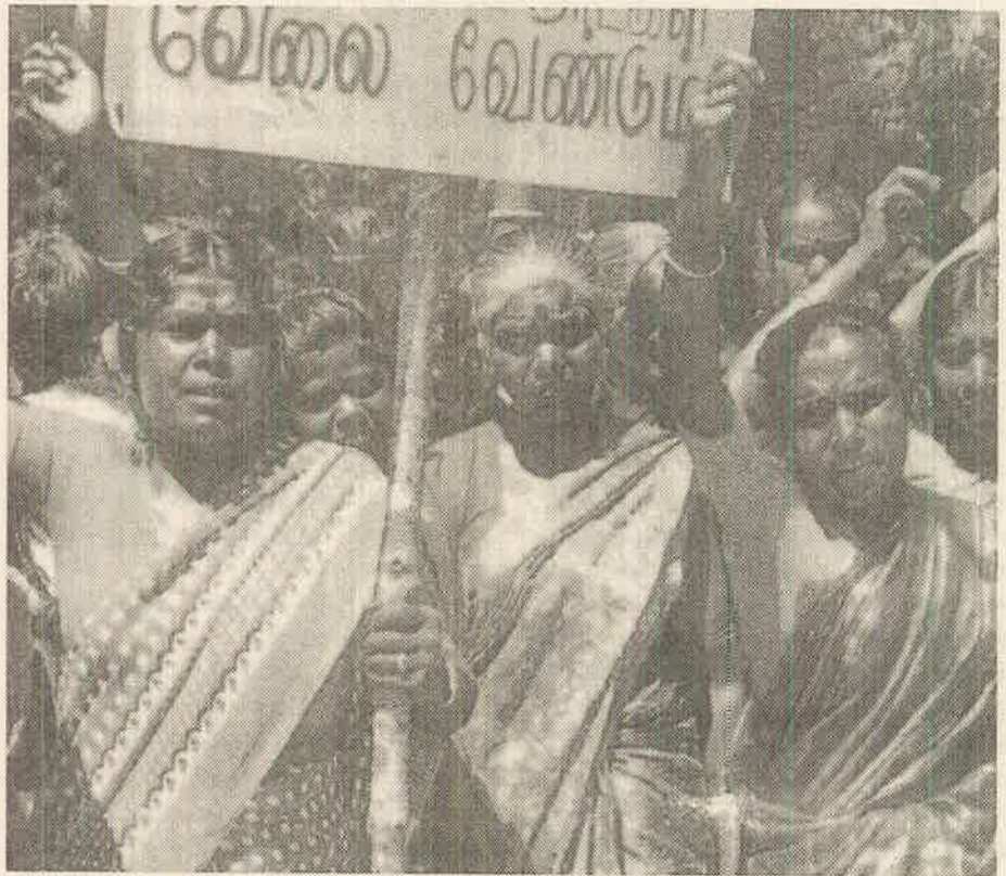
தோட்ட பெண் தொழிலாளர்கள்

சம்பளக் கோரிக்கையை முன்னணியில் கொண்டிருந்தாலும் தோட்டத் தொழிலாளர் போராட்டம் வெறும் சம்பளப் போராட்டமாக