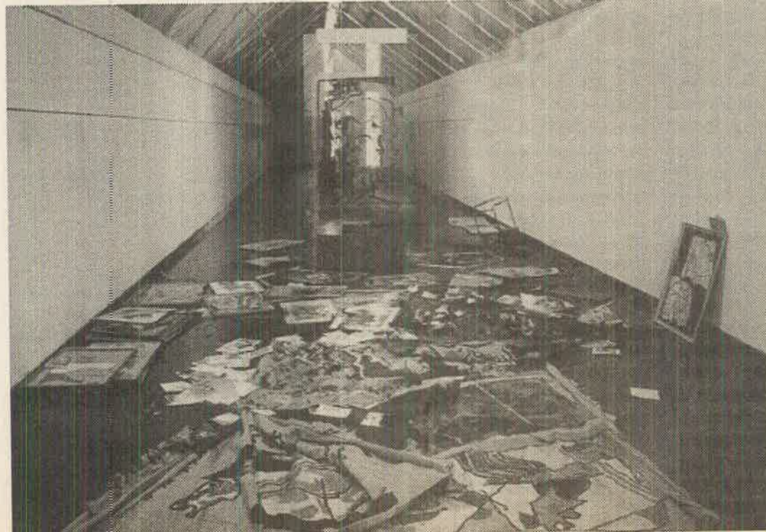
இந்து சோவ்னிஸ்டுகளால் நாசமாக்கப்பட்ட ஹுசேனின் கலைப் படைப்புகள்

இங்கு கலைப் படைப்புகளுக்கு தனிச்செய்ய போடுவது இஸ்லாம் மதத்தினது வேலை மட்டும் தானா என்ற கேள்வி நனவு படைத்த எவரும் எழுப்பும் ஒரு முக்கிய கேள்வியாகும். இலங்கையை எடுத்துக் கொண்டால் இந்த இஸ்லாம் எதிர்ப்பாளர்கள் மறந்து போய்விடும் பல சந்தர்ப்பங்களை நினைவில் கொணர முடியும். இன்று நேற்றல்ல பல தசாப்தங்களுக்கு முன்னர் மார்க்ஸ்டின் விக்ரமசிங்க கௌதம புத்தரின் வாழ்க்கையை பின்னணியாகக் கொண்டு "பவதரணய" என்ற நூலை எழுதிய போது அவர் பௌத்த மதத்தை அவமானம் செய்து விட்டதாக பெளத்த பிக்குகள் துள்ளிக் குதிக்க இல்லையா?