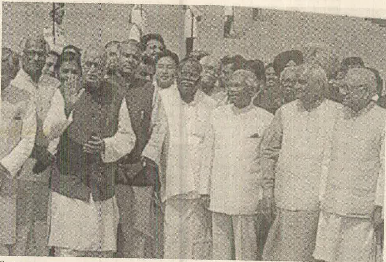
இந்திய வலதுசாரி அரசாங்கத்தின் முக்கிய புள்ளிகள் - அத்வானி, வாஜ்பாய்

இந்தியப் பொதுத் தேர்தல் முடிவுகளும் அதைத் தொடர்ந்து வந்த அரசியல் நிலைமைகளும் அந்நாட்டின் ஏகாதிபத்தியச் சார்பு முதலாளி வர்க்க ஆட்சியின் ஈடாட்ட நிலைமையையும் பிரமாண்டமான சமூக