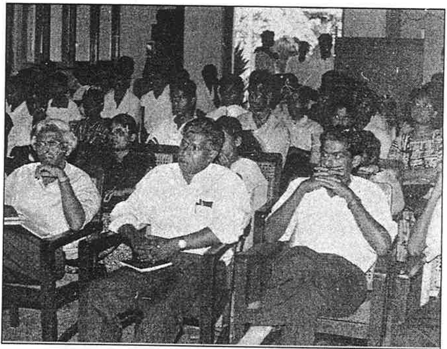
பெப்ரவரி 16ம் திகதி கொழும்பு சாரணர் சங்க தலைமையக மண்டபத்தில் இடம்பெற்ற இலவசக் கல்வி பேணும் நடவடிக்கைக் குழு கூட்டம்