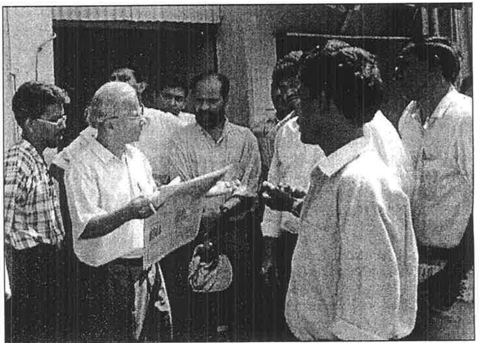
கொழும்பு துறைமுக இறங்கு துறைகள் தனியார்மயமாக்கப்படுவதை எதிர்த்து போராட்டத்தில் ஈடுபட்ட துறைமுக ஊழியர்களிடையே பிரச்சாரம் செய்யும் சோ.ச.க. அங்கத்தவர்கள்

3) மிகுந்த ஊக்கத்துடன் பிரசுரித்திருந்தது. அதே பத்திரிகை தொழிலாளரின் விடுமுறை உட்பட்ட சேவை நிலைமைகளுக்கு வேட்டுவைக்கும் அரசின் பிற்போக்கு அவசியத்தை குறிப்பிடுகையில் மேலும் கூறியதாவது: சிங்கப்பூர், துபாய், முதலிய நாடுகளில் 235 நாட்கள் வேலை நாட்களாக இருக்கையில் இலங்கையில் 180 நாட்கள் மட்டுமே வேலை நாட்களாக உள்ளது. ஜப்பானில் ஆண்டொன்றுக்கு 256 நாட்கள் - உயர்ந்த எண்ணிக்கை வேலை நாட்களாக உள்ளது" எனக் கூறுவதன் மூலம் இத்தயாரிப்புக்கு எதிரான போராட்டத்துக்கு ஆயத்தமாகும் தொழிலாளரை "குழப்பியடிப்பவர்களாக" பேர்கூட்டி எச்சரிக்கை செய்கின்றது. அரசாங்கத்தின் இந்த அடக்குமுறைப் பிரச்சாரத்துக்கு ஆதரவாக சிறீலங்கா சுதந்திர தொழிலாளர் சங்கமும் ஜே.வீ.பி.யின் அகில இலங்கை துறைமுக ஊழியர் சங்கமும் கூட்டுச் சேர்ந்துள்ளன. சி.ல.ச.க.தொழிற் சங்கம் வெளிவெளியாகவே சுருங்காலி வேலை செய்கையில் ஜே.வீ.பி.தொழிற்சங்கம் தொழிலாளர் போராட்டத்தை "யூ.என்.பி.சதி" என பெயர் சூட்டியுள்ளது. இந்நிலையில் பாலாதம்பு தலைமையிலான சீ.எம்.யூ.வின் வங்குரோத்து வலதுசாரி தொழிற்சங்க