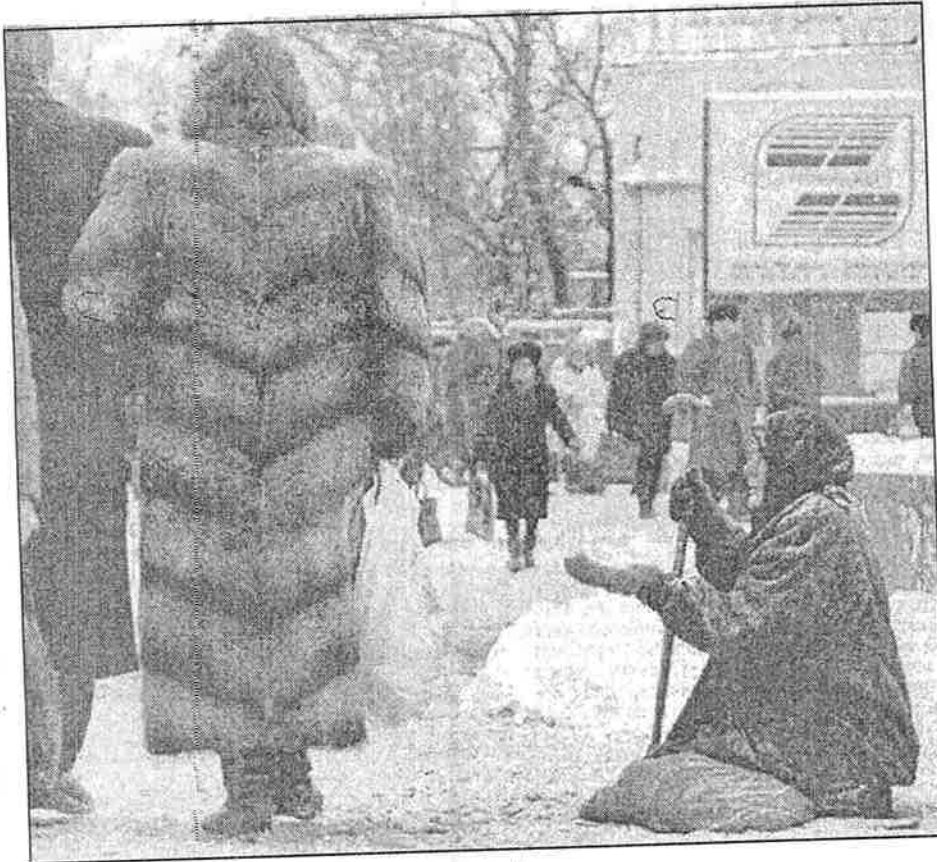
மாஸ்கோ வீதியில் பிச்சை எடுக்கும் ரூஷ்ய முதாட்டி