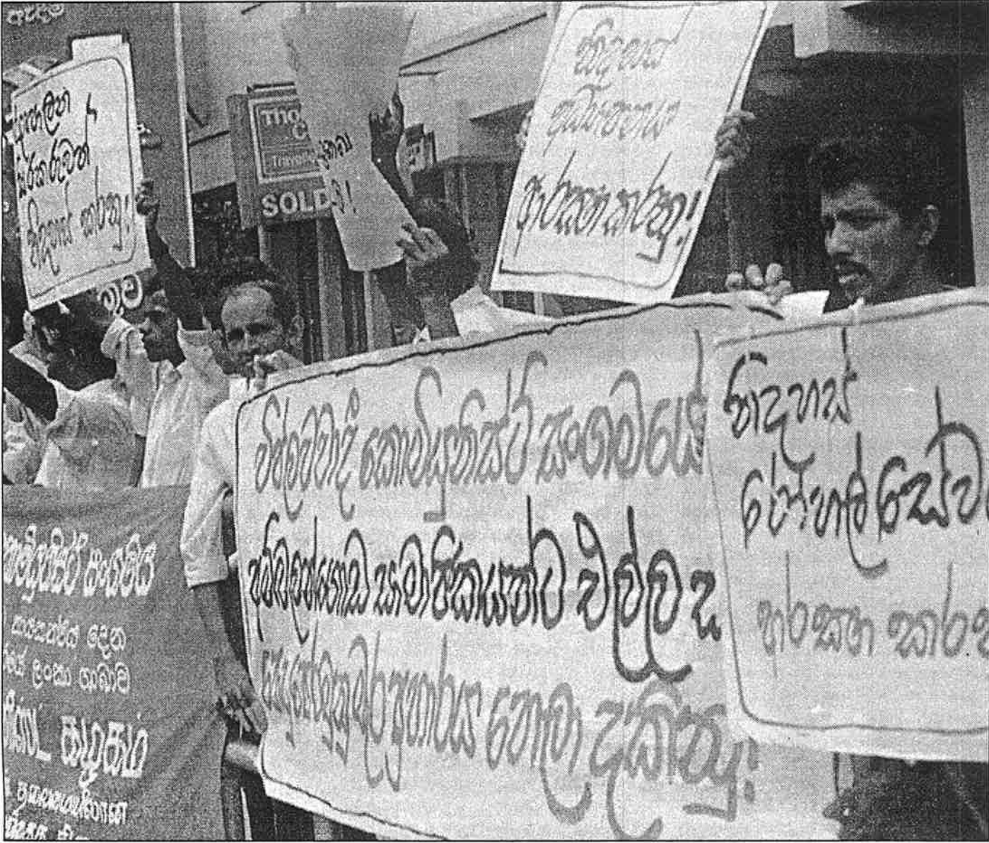
அம்பலாங்கொடை சோ.ச.க. அங்கத்தவர்களின் மீது பொதுஜன முன்னணி குண்டர்கள் நடாத்திய தாக்குதலுக்கு எதிரான மறியல்

அரசாங்கமும் முதலாளி வர்க்கமும் இப்போது திட்டமிட்டிருப்பது பொதுமக்களின் கைகளில் எஞ்சியுள்ள மிச்ச சொச்ச உரிமைகளையும் தட்டிப்பறித்து அவர்களை வறுமைக்குள் தள்ளிவிடுவதற்கேயாகும். தனியார்மயத்தை பூர்த்திசெய்வது, நலன்புரி சேவைகளிலும் இலவசக் கல்வி, சுகாதார சேவைகளிலும் எஞ்சியுள்ளவற்றையும் தட்டிப்பறிப்பது அரசாங்கத்தின் நிகழ்ச்சி நிரலில் சேர்ந்து கொண்டுள்ளது. உலக வங்கியும் சர்வதேச நாணய நிதியமும், ட்ரான்ஸ்நேஷனல் கூட்டுத்தாபனங்களும் இந்த நிகழ்ச்சி நிரலை தாமதமின்றி அமுல் செய்யுமாறு நெருக்கிவருகின்றன. தொழிலாளர்களையும் ஒடுக்கப்படும் மக்களையும் சிறையில் விலங்கு மாட்டித் தள்ளியோ அல்லது கொன்றுதள்ளியோ இந்த வேலைத்திட்டத்தை அமுலுக்கி அரசாங்கம் தயாராக உள்ளது. தனியார்மயத்தை எதிர்த்த உருக்குக் கூட்டுத்தாபனத் தொழிலாளர்களைத் தாக்கும்படி பொலிசாரை தூண்டிவிட்டு, கொரியன் முதலாளிகள் அந்நாட்டு தொழிலாளர்களை தாக்கிய விதத்தினை ஜனாதிபதி பின்வருமாறு நினைவுட்டினார்: "கொரியாவில் தொழிலாளர்கள் எதிர்ப்புக் காட்டினால் அவன் அல்லது அவன் சிறைக்குள் தள்ளப்படுவர்".