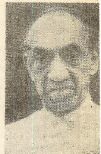
ஜே. ஆர். ஜயவர்தன

யதார்த்தத்தில் சாத்தியமான எல்லா தீர்வுகளினும் ஜனநாயகமானதை அடைய தற்கான சிறந்த உத்தரவாதம் இதுவே. சகல தேசிய இனங்களும் முதலாளி வர்க்கங்கள் தனது சொந்த நலன்களிற்கு — ஏனைய தேசிய இனங்களின் நிலையை கவனத்தில் எடுக்காமல் — உத்தரவாதம் வேண்டி நிற்றகைய தொழிலாள வர்க்கத்தை இந்த உத்தரவாதத்தை மட்டுமே வேண்டுகின்றது.