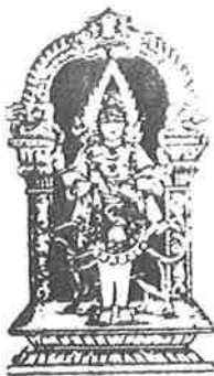
சுவசுந்தரி ஓரணுவும் அரையாது