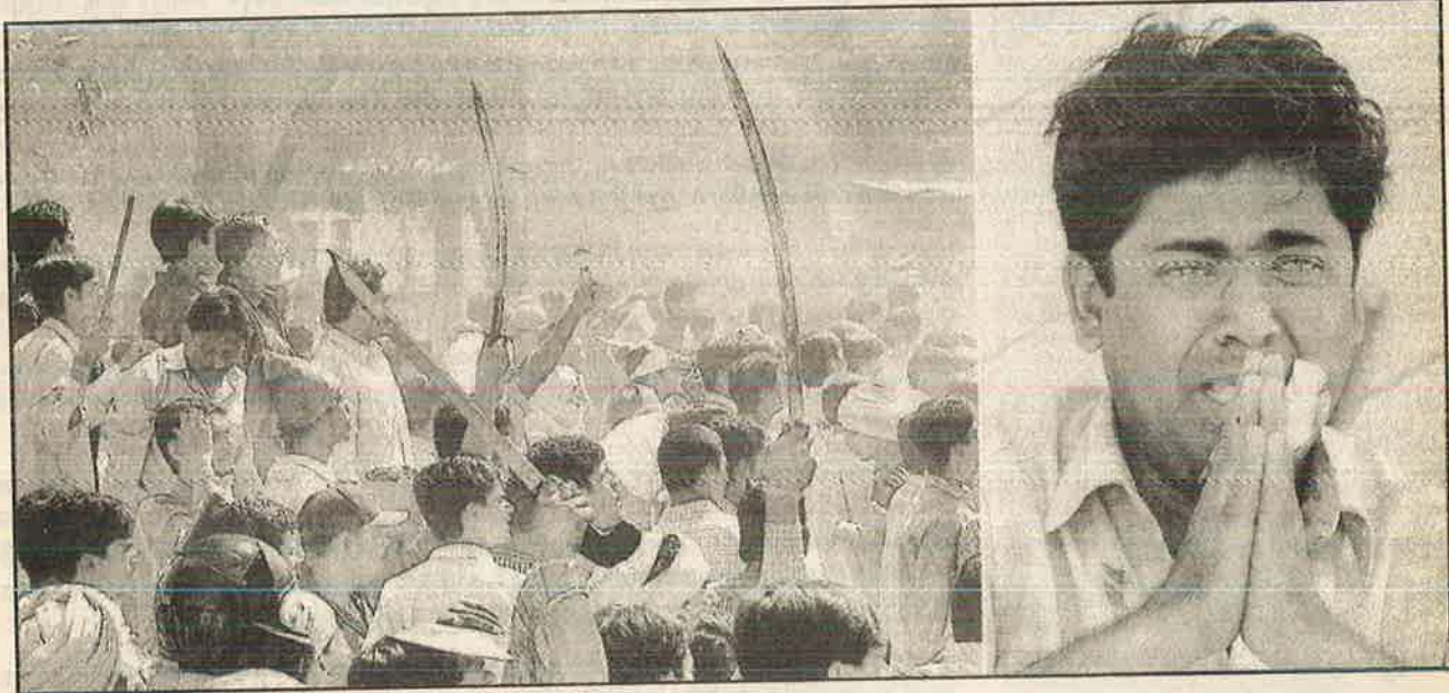
அகமதாபாத் நகரின் தெருக்களில் முஸ்லிம்களுக்கு எதிராக வாளை சுழற்றும் இந்து வெறியர்கள்