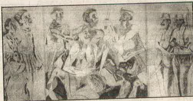
சுண்டூர் படுகொலை பற்றிய ஓவியம்