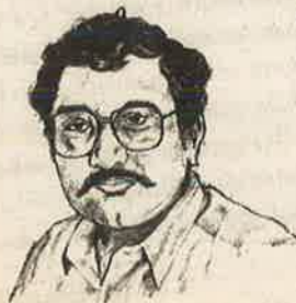
எழுச்சி தலித் முரசு