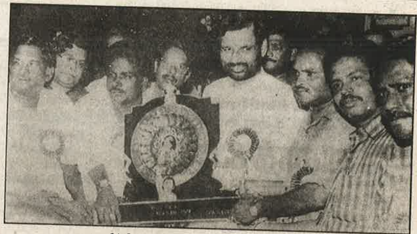
புதுவை தலித் சேனா மாநில மாநாட்டில் திரு. ராம்விலாஸ் பாஸ்வான் அவர்களுக்கு நினைவுப் பரிசு வழங்கப்படுகிறது

த லித் சேனா எந்த ஒரு சாதிக்காகவோ, ஒரு மதத்துக்காகவோ உருவாக்கப்பட்ட இயக்கம் அல்ல. சமூகத்தில் உள்ள வேற்றுமைகளைக் களைய உருவாக்கப்பட்ட இயக்கமாகும்" என்று புதுவையில் நடைபெற்ற தலித் சேனா வின் முதல் மாநில மாநாட்டில் மத்திய தொலைத் தொடர்புத் துறை அமைச்சரும் தலித் சேனாவின் தேசியத்தலைவருமான திரு. ராம்விலாஸ் பாஸ்வான் கூறினார்.