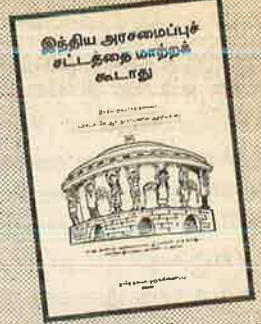
பக்கம்: 28 விலை: ரூ. 5

வெளியீடு: தலித் தகவல் ஒருங்கிணைப்பு # - 21, கே.கே. நகர், சென்னை - 600 078