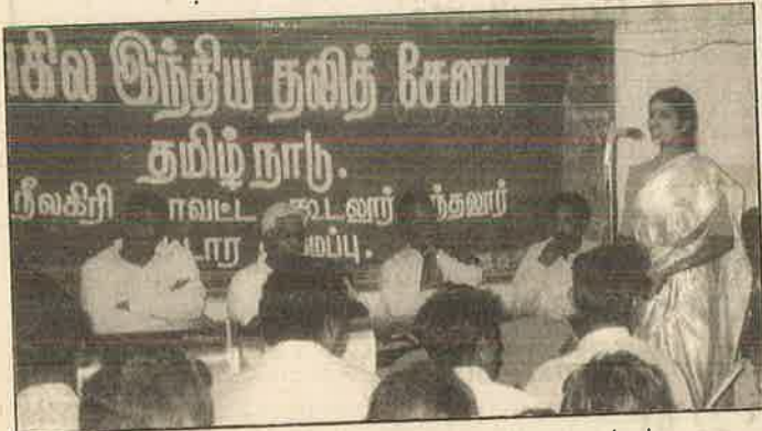
நீலகிரி மாவட்டத்தில் நடைபெற்ற தலித் சேனா கூட்டம்

எனவே, இவர்களுக்கு நிலங்களை வழங்குவதுதான் எனது உண்மையான கடமையாகும். பெரிய பெரிய தொழிற்சாலை அதிபர்களிடத்தில் பணம் இருக்கலாம்; ஆனால், பாசம் இருக்காது. பெரிய பெரிய தொழிற்சாலை அதிபர்களிடத்திலே வாகன வசதிகள் இருக்கலாம்; வாஞ்சை இருக்காது. பெரிய பெரிய தொழிற்சாலை அதிபர்களிடத்திலே எந்திரங்கள் பல இருக்கலாம்; ஆனால், இதயம் இருக்காது. உண்மையான இதயம் உள்ள ஏழை எளிய மக்களுக்குப் பணி செய்வது எனது கடமை. நான் இதற்காக சம்பளம் பெறுகிறேன். உங்களிடையே கைத்தட்டல் வாங்க வேண்டும் என்ற தற்காக நான் இதை பேசவில்லை. நான் எந்த நேரத்திலும் உங்களுக்கு