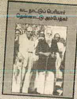
பக்கம்: 88 விலை: ரூ. 20