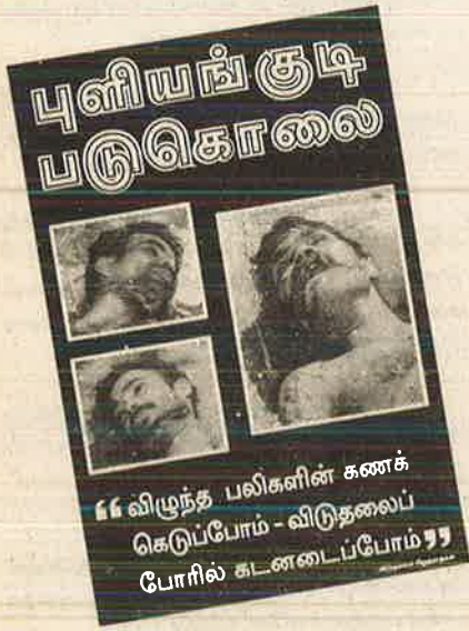
பேரணியில் காணப்பட்ட சுவரொட்டி

புளியங்குடி படுகொலையைக் கண்டித்து விடுதலைச் சிறுத்தைகளின் மாபெரும் அணிவகுப்பு