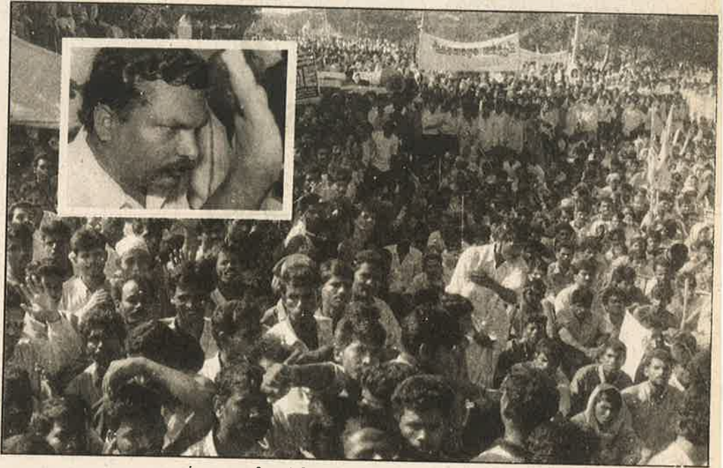
கண்டன அணிவகுப்பில் கலந்து கொண்டவர்களில் ஒரு பகுதி

மடக்கி முந்திரிக் காடுகளுக்கு கடத்திச் சென்று உயிரோடு கொளுத்தி விடுவதாக மிரட்டி வருகின்றனர். இத்தகைய சனநாயக விரோத வன்முறைக் கும்பலான பா.ம.க.வை தேர்தலில் நிற்கத்தடை செய்ய வேண்டுமென இப்பேரணியின் கோரிக்கையாக தமிழக அரசையும் தேர்தல் ஆணையத்தையும் கேட்டுக்கொள்கிறோம்" என்றார்.