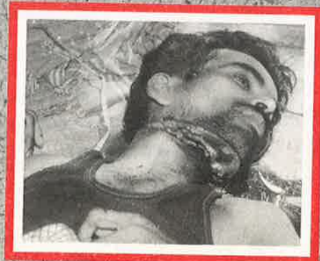
புளியங்குடியில் படுகொலை செய்யப்பட்ட மூன்று தலித் இளைஞர்களில் ஒருவர்