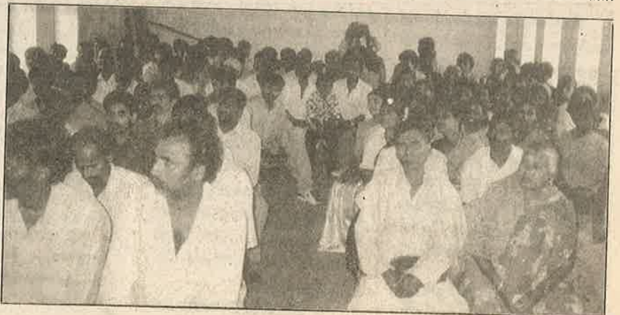
தலித் சேனா கூட்டத்தில் பங்கேற்ற ஆர்வலர்கள்