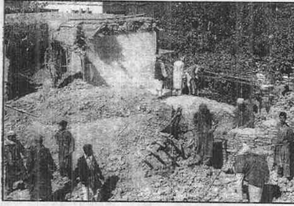
அமெரிக்க குண்டுக்கு இலக்கான வீடு

- ஈராக் மீது பொருளாதாரத் தடை விதித்து கடந்த பத்தாண்டுகளில் சுமார் 50,000 குழந்தைகள் மருந்து கிடைக்காமல் மரணம் அடையக்