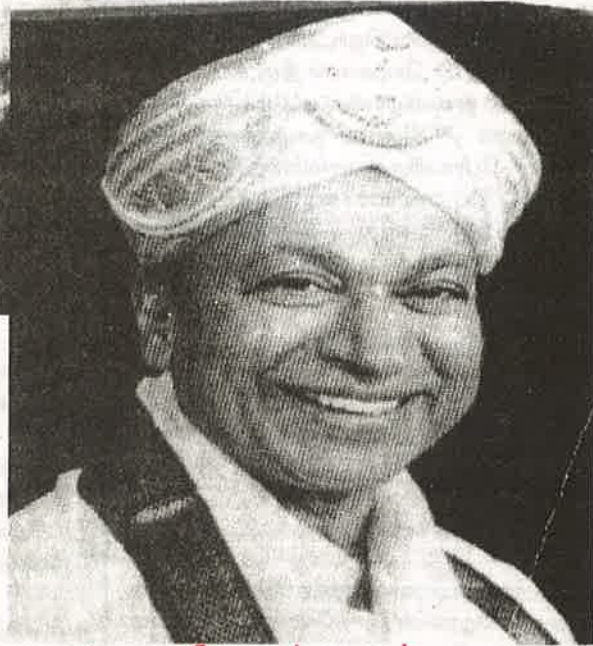
கடத்தலும் கலைந்த அரிதாரங்களும்