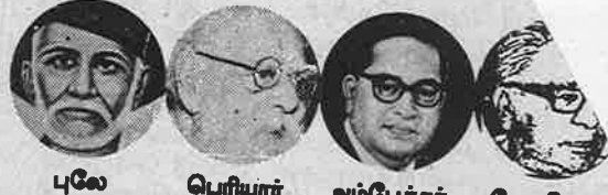
புலே பெரியார் அம்பேத்கர் லோகியா

இந்தியாவில் பொதுவுடைமை மலர் மார்க்சிய - பெரியாரிய நெறியில் தேசிய இனவழிப்பட்ட சம உரிமை உடைய சமதர்மக் குழுஅரசர்கள் இருங்கிணைந்த உண்மையான கூட்டாட்சி அமைய ஆவன செய்தல்