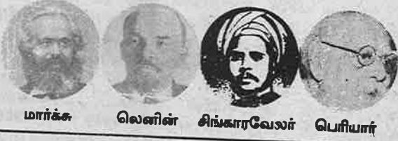
மார்ச்சு லெனின் சிங்காரவேலர் பெரியார்