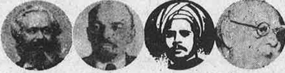
மார்க்கு லெனின் சிங்கராவேலர் பெரியார்