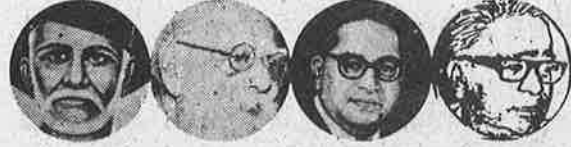
புலே பெரியார் அம்பேத்கர் லோகியா

இந்தியாவில் பொதுவுடைமை மலர மார்க்கிய - பெரியாரிய நெறியில் தேசிய இனவழிப்பட்ட சம உரிமை உடைய சமதர்மக் குடிஅரசுகள் ஒருங்கிணைந்த உண்மையான கூட்டாட்சி அமைய ஆவன செய்தல்