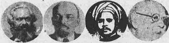
மார்க்க லெனின் சிங்காரவேலர் பெரியார்