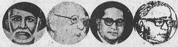
புலே பெரியார் அம்பேத்கர் லோகியா

இந்தியாவில் பொதுவுடைமை மலர் மார்க்சிய - பெரியாரிய நெறியில் தேசிய இனவழிப்பட்ட சம உரிமை உடைய சமதர்மக் குழுஅரசுகள் ஓருங்கிணைந்த உண்மையான கூட்டாட்சி அமைய ஆவன செய்தல்