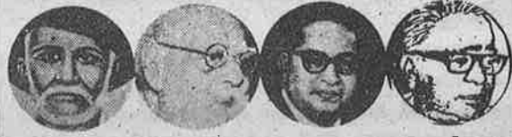
புலே பெரியார் அம்பேத்கர் லோவியா

இந்தியாவில் பொதுவுடைமை மலர மார்க்சிய - பெரியாரிய நெறியில் தேசிய இனவழிப் பட்ட சம உரிமை உடைய சமதர் மக் குடிஅரசுகள் ஒருங்கிணைந்த உண்மையான கூட்டாட்சி அமைய ஆவன செய்தல்