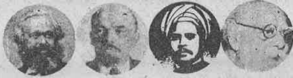
மார்க்ச லெனின் சிங்காரவேலர் பெரியார்