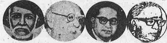
புலே பெரியார் அம்பேத்கர் லோகியா

இந்தியாவில் பொதுவுடைமை மலர மார்க்சிய - பெரியாரிய நெறியில் தேசிய இனவழிப்பட்ட சம உரிமை உடைய சமதர்மக் குடிஅரசுகள் ஒருங்கிணைந்த உண்மையான கூட்டாட்சி அமைய ஆவன செய்தல்