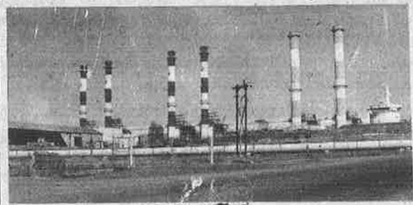
தபோல் மின்நிறுவனம் (DPC)

அந்நியர் படையெடுப்புகளும், அதன் விளைவுகளும் என்று வரலாற்றில் இப்போது படிப்பது போல், இனி வரும் காலத்தில் பன்னாட்டு நிறுவனங்களின் படையெடுப்புகளும் அவற்றின் மோசடிகளும் என்று நாம் படிக்கப்போகும் நாளின் வெகு தொலைவில் இல்லை.