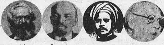
மார்க்ஸ் லெனின் சிங்காரவேலர் பெரியார்