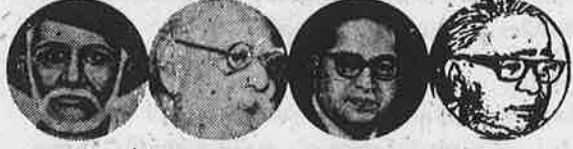
புலே பெரியார் அம்பேத்கர் லோஹியர்

இந்தியாவில் பொதுவுடைமை மலர மார்க்சிய - பெரியாரிய நெறியில் தேசிய இனவழிப்பட்ட சம உரிமை உடைய சமதர்மக் குழுஅரசுகள் ஓருங்கிணைந்த உண்மையான கூட்டாட்சி அமைய ஆவன செய்தல்