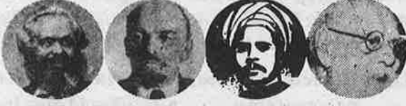
மார்க்கசு லெனின் சிங்காரவேலர் பெரியார்