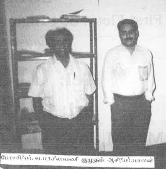
பேராசிரியர். எ. மாசீலாமணி குழுதம் ஆசிரியர் மாலை