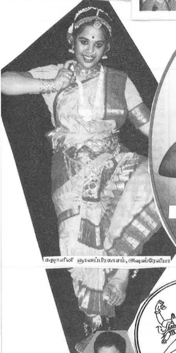
கஜாள்வி ஞானப்பிரகாசம், அபுஸ்ரேலியா