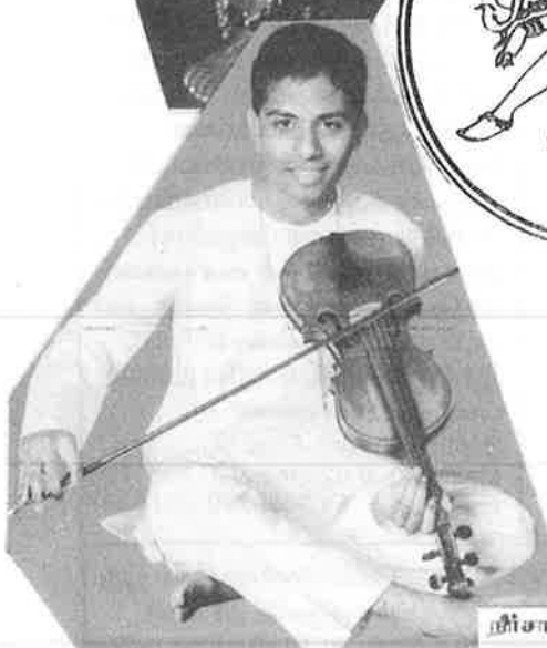
நிர்சாந்தன் பார்த்தகின், லண்டன்