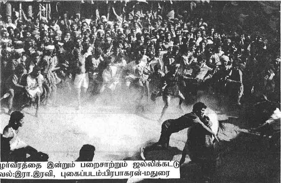
தமிழர் வீரத்தை இன்றும் பறைசாற்றும் ஜல்லிக்கட்டு தகவல்: இரா. இரவி

Editor/Publisher: N. S. PIRABU B.Sc., Dip. Jour, SARVADESA TAMILER, L. Hervigsv69A, 3035 Drammen, Norway, Tel. Fx: 32. 813416 (nsp@c2i.net)