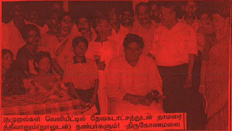
குமுறல்கள் வெளியீட்டில் தேவகடாட்சத்துடன் தாமரை த்தீவானும்(நூலுடன்) நண்பர்களும்! -திருகோணமலை