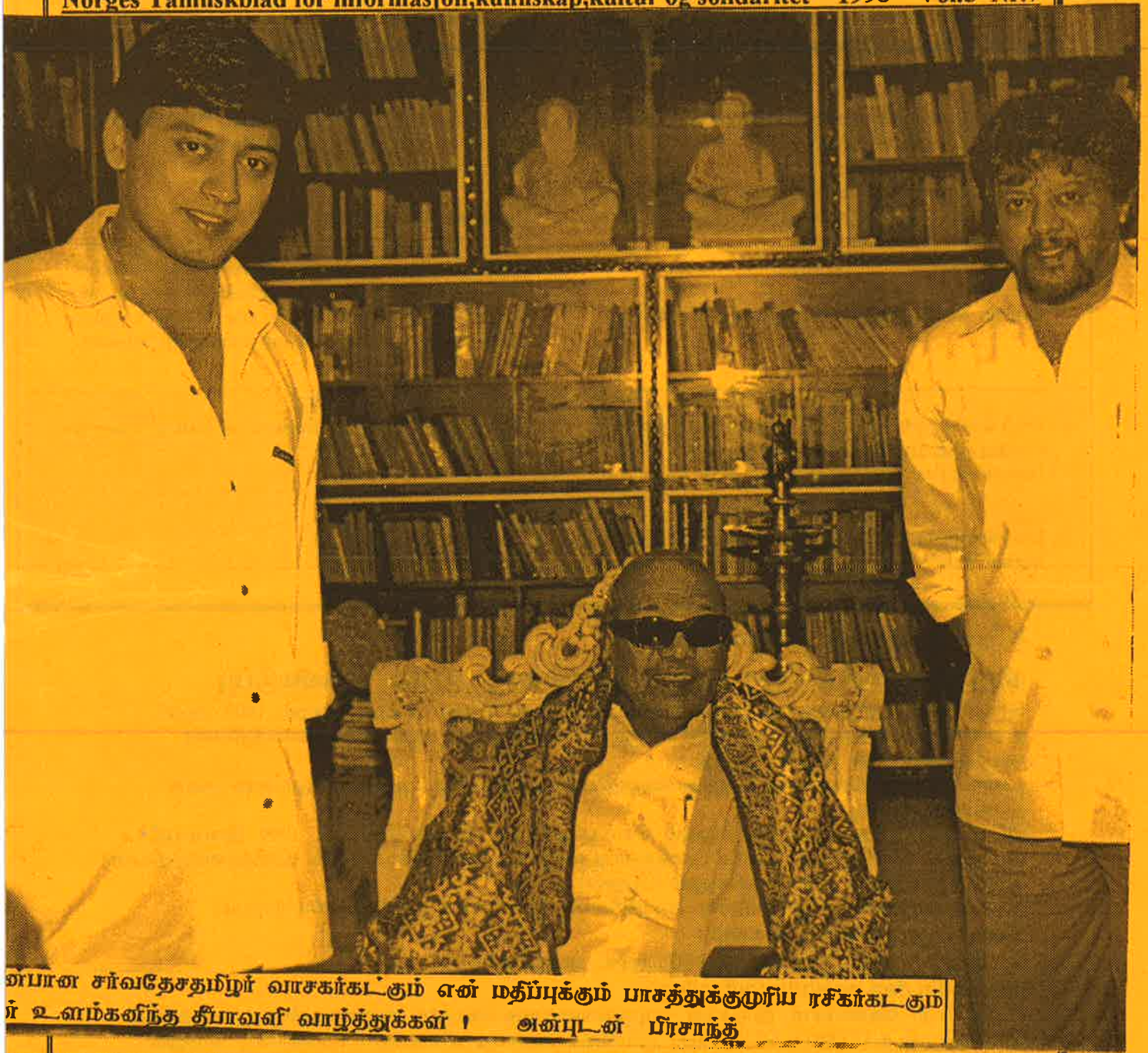
என்பான சர்வதேசதமிழர் வாசகர்கட்கும் ஏன் மதிப்புக்கும் பாசத்துக்குமுரிய ரசிகர்கட்கும் ர் உளம்களிந்த தீபாவளி வாழ்த்துக்கள் ! அன்புடன் பிரசாந்த்

Norges Tamilskeblad for informasjon, kunnskap, kultur og solidaritet 1998 Vol.5 Nr.7