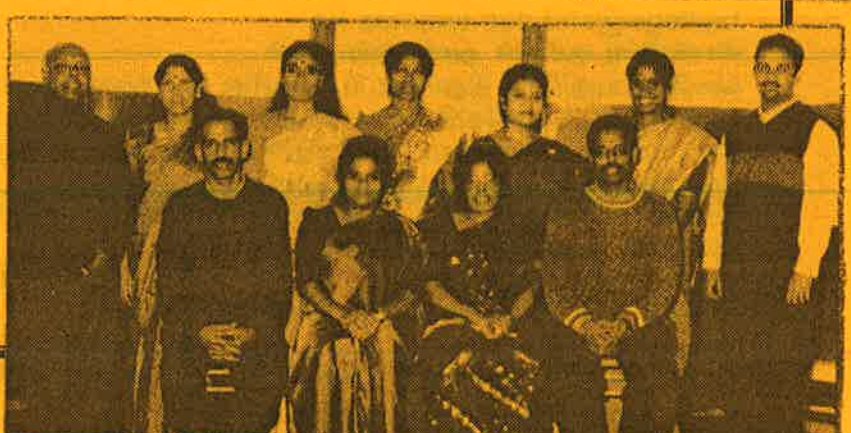
முத்தமிழ் அறிவாலய ஆசிரியர்கள்