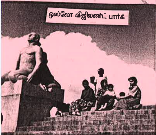
ஒஸ்லோ விஜிலண்ட் பார்க்