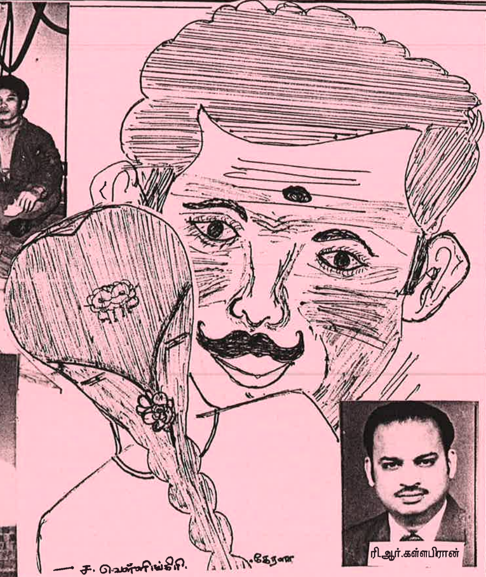
— ச. வெள்ளிச்சி. கேரண