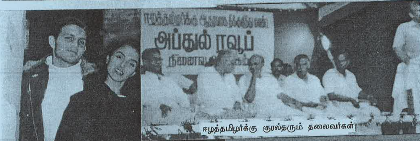
ஈழத்தமிழர்க்கு குரல்தரும் தலைவர்கள்