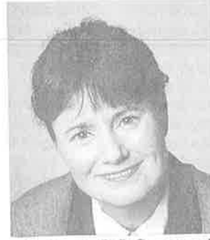
அபிவிருத்திநிதி அமைச்சர்: காரி நூர்கைம் லார்சன்