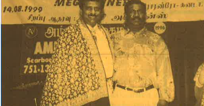
கனடாவில் பாராட்டுப்பெற்ற அன்றன்டேவீட், ஓஸ்லோவில் கிசைத்தட்டு வெளியிட்டார்.