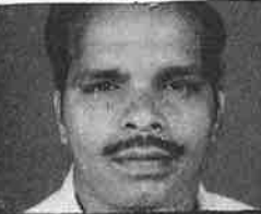
எகஸ்தோரா - எம்.பி.நிர்மல்

Norway Tamil magazine to co-ordinate the Tamils for advancement & solidarity!