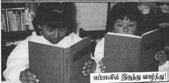
யப்பானில் இருந்து வாழ்த்து!

ஜனநாயகம் அகர்த்தி ஒன்றை கில்வாண்டு 10 வருஷியிடம். பெல்லாமின் எகஸ்தோரா. எகஸ்தோரா புத்தாண்டு வாழ்த்துக் கள்.