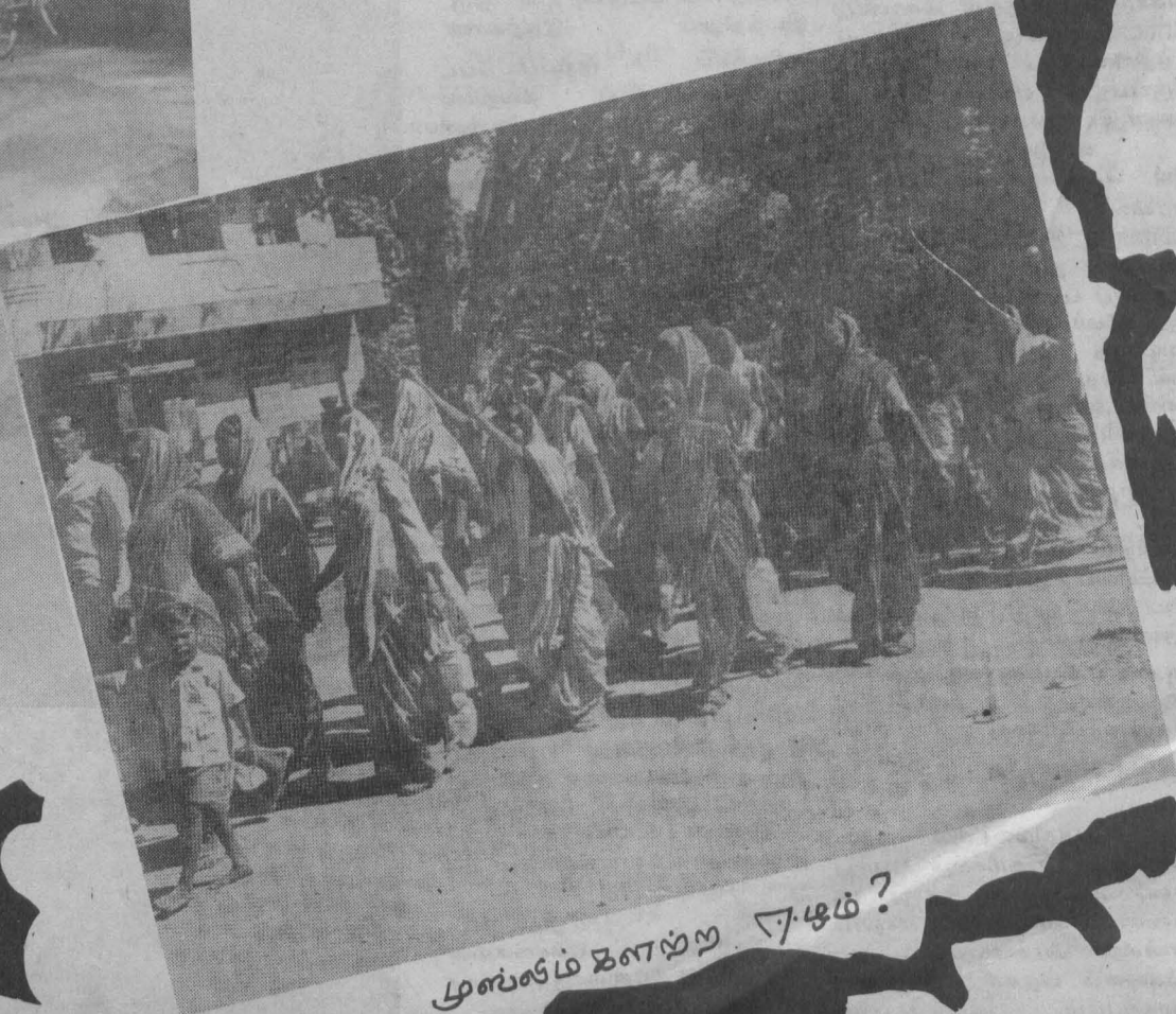
முன்பும் களத்த ந.கும்?

அடுத்த கதழில் : மலையக மக்களுக்கு ஒரு தனி புகாரும் சேவைமா? - கருத்தாடல்