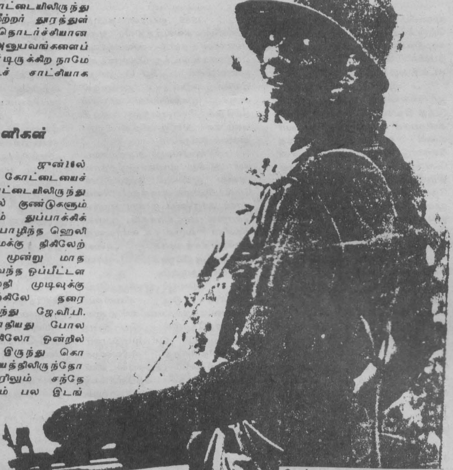
செய்ய ஏலாது. (யக்கோ. தேவஸ்தானய நேத, கறண்ட தெயக் நா தால இவறாய்) 3. "தாக்குதல் முடிந்தது. தளத்துக்குத் திருப்பு" என்று சொல்லி ஒரு நிமிடத்தில் ஹெலிகப்டர்

ஒப்பீட்டளவில் பாதுகாப்பான இடங்களுக்குச் சகோதரிகள் மாற்றப்பட்டுள்ளார்கள். சகோதரிகள் தமது நாளாந்த பிரார்த்தனையை கூட செய்ய முடியவில்லை. சுற்றி வரப்பார்ப்பதும் அவற்றை தெரிவிப்பதுமே இன்றைய மிக உயர்ந்த வழிபாடாக உள்ளது எமக்கு. இத்தகைய நிலைமையில் கீழான எமது வாழ்க்கை உண்மையில் அற்புதம்தான். அமைதியாக கவலைப்படுவதுதான் எமது நாளாந்த அனுபவமாக இருந்து வந்தது. ஆனால் இப்போது நாம் எமது எல்லை அடைந்து விட்டதால் சகோதரிகளாகிய உங்களுடன் பகிர்ந்து கொள்ள நாம் பலத்து அமுலு தேவையாக உள்ளது. இந்த அமுலை வெறும் காட்டுக்குள் அமுத அமுலையாக இல்லாமல் உங்களது உள்ளத்தில் எம் சார்பாக எதிரொலித்து ஏதாவது நடைமுறைக்கான சிந்தனைகளை தோற்றுவிக்கும் என நம்புகிறோம்.