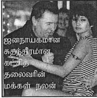
ஜனநாயகமான சுதந்திரமான கட்சித் தலைவரின் மக்கள் நலன்

எகாதிபத்திய தயவு பெற்று, அதில் இருந்து மார்க்சிய ஆய்வு, திருத்தம் என்று பலவண்ண வடிவங்களை முன் தள்ளினார். ஆனால் மார்க்சிய தலைவர்கள் எப்படி வாழ்ந்தார்கள். அவர்களின் எளிமையான வாழ்க்கையின் துரும்பைக் கூட இவர்கள் எட்ட முடியாது.