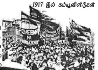
1917 இல் கம்யூனிஸ்டுகள்