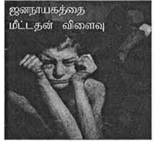
ஜனநாயகத்தை மீட்டதன் விளைவு

அடுத்தவன் 30 களில் ஜெர்மன் கம்ப்யூனிஸ்ட் கட்சியில் சேர்ந்ததுடன், சோவியத்துணியன் சென்று வந்த கீஸ்லர் ஆவன். ஸ்பெயின் பாசிச எதிர்ப்பு போரில் பங்கு பற்றியதுடன் சிறை சென்ற இவன், சர்வதேச நிர்பந்தம் காரணமாக விடுதலை செய்யப்பட்டவன். அந்த யுத்தத்தில் பாசிச எதிர்ப்பு பத்திரிகையாளராக செயல்பட்டவர். இவரை பிரபலமாக்கிய நூல் "பகலில் இருள்" என்பது ஸ்டாலினை கொடுகோலனாக வருணித்த நூலாகும். புகாரின், ஜிகோவியேவ் போன்றவர்கள் மீது பகிரங்கமான விசாரணை, சர்வதேச பத்திரிகையாளர்கள் முன் நடைபெற்றது. அது தொடர்பாக "அவர்கள் ஏன் குற்றத்தை ஒப்புக் கொண்டார்கள்?" என்ற கேள்வியை எழுப்பி, அதை மிரட்டி வாங்கினார்கள் என்பதை சொல்லமுடியாது. விசாரணை பகிரங்கமாக நடைபெற்றது. அத்துடன் அவர்கள் தமது செயலை கொள்கையாக விசாரணை மண்டபத்தில் பிரகடனம் செய்தவர்கள் அல்லவா. அதை இவர் "அவர்கள் இத்தனை காலம் பொருள் முதல்வாதிகளாக இருந்தார்கள்; எனவே மார்க்சியம் தான் அவர்களுடைய எதிர்ப்புணர்வையே உறுஞ்சி விட்டது" என்றாரே இந்த இடதுசாரி. இது எல்லாம் குற்றத்தை தமது சொந்த பிரகடனங்கள் ஊடாக ஒப்புக் கொண்டதை சகிக்கமுடியாத, ஸ்டாலின் எதிர்ப்பில் பிதற்றியவையே. மேலும் "நாம் முரணற்றவர்கள் அல்ல; முரணற்றவர்களாக மாற வேண்டும் என்பதற்கான முயற்சி நம்மை எங்கே கொண்டு சேர்க்கும் தெரியுமா? அதோ கம்ப்யூனிஸ்டுகளைப் பாருங்கள்!" என்றார். முரண்பாட்டை "உறிஞ்சும்" மார்க்சியத்தை "எதிர்ப்பை உறிஞ்சும்" மார்க்சியமாக விகாரப்படுத்தி காட்டுவதன் மூலம், ஸ்டாலின் எதிர்ப்பு ஒழுங்கமைக்கப்பட்டது. இவர் "தவறிழைத்தவன் தனதுடைய தவறை எப்படி ஒப்புக்கொள்ள முடியும்" என்ற எழுப்பும் வாதத்தின் பின்பு, ஸ்டாலின் மீதான கழிப்பு