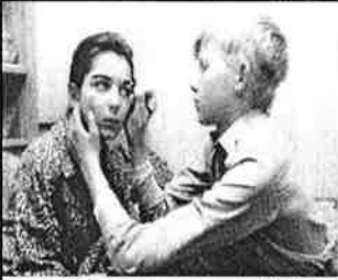
சுதந்திரத்தை மீட்ட போது விபச்சாரம் ஜனநாயகமானது

இனி நாம் ஏகாதிபத்தியம் வைக்கும் மற்றைய புள்ளி விபரங்கள் சிலவற்றை சுருக்கமாகப் பார்ப்போம்.