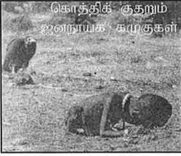
கொத்திக் குதறும் ஐனநாயக கருகுகள்

முத்திரை குத்துவதே "மார்க்சியம்" என்றளவுக்கு மார்க்சியத்தை எளிமைப்படுத்தி, சம்பவங்களின் பின் காது மூக்கு வைத்து முத்திரை குத்தி, உயிர்வாழ நினைக்கும் அரசியல், இழிவான நயவஞ்சகத் தன்மை கொண்டவை. அரசியல் ரீதியாக பிரச்சனையை ஆராய்வது அடிப்படையானது. பிரச்சனையை கைவிட்டுச் விவாதிக் காது ஒருவது பற்றி லெனின் மென்ஷ்விக்குகளுக்கு எதிராக போராடிய போது "கொள்கை ரீதியான பிரச்சனையில் எதிராளியினுடைய ஒரு வாதத்திற்கு பதில் சொல்லாமல் அவன் மீது 'இரக்கம்'