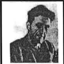
விலங்குப்பண்ணை என்ற ஸராலின் எதிர்ப்பு நாவலை எழுதிய சுதந்திர பிரிட்டிஸ் உளவாளியான ஜாஜ் ஆர்வெல்

முகங்கள் 1996 யூலையில் அம்பலமானது. இவர்கள் பிரிட்டிஸ் உளவுத்துறையில் கைக்கூலியாக இருந்து கம்ப்யூனிசத்தை திருத்தி எழுதவும், ஸ்டாலின் மற்றும் கம்ப்யூனிச எதிர்ப்பு போராளியாக இருந்தது உலகையே வியக்கவைத்தது.