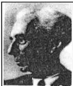
பிரிட்டிஷ் உளவாளியான இடது சாரி பெர்டான்டு ரஸ்ஸல்