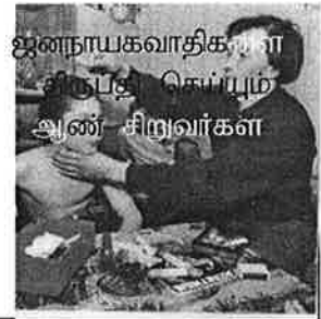
ஜனநாயகவாதிகளால் திருப்தி செய்யும் ஆண் சிறுவர்கள்