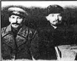
ஸ்டாலின் - லெனின்

ஸ்டாலின் பற்றிய இவ் இதழை கொண்டு வரவேண்டிய அளவுக்கு வரலாற்றுச் சூழல் கோருகின்றது. மக்களின் நலன்களை கைவிட்டு ஓட்டம் பிடிக்கும் அரசியல் போக்கில், தொழ்நிக் கொள்வோர் ஸ்டாலின் மீதான தாக்குதலை குவிக்கின்றனர். மார்க்சியத்தை பாதுகாத்து, அதன் புரட்சிகரமான பாத்திரத்தை மீள முன்னிறுத்தும் எனது போராட்டத்தில், கோட்பாட்டு ரீதியாக முகம் கொடுக்க முடியாதவர்கள், ஸ்டாலின் ஊடாக தாக்குதலை நடத்துகின்றனர். மறு பக்கத்தில் எனக்கூடாக