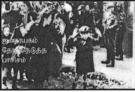
ஜனநாயகம் தோற்றுக்கொண்ட பாசிசம்

தன்மைக்கும் அடிப்படையானது என்கின்றார். இந்த இடதுசாரி, பாசிசம் தோற்கடிக்கப்பட்ட பின்பு கவலையற்று "ரசியா மேலை நாடுகளிடம் நிபந்தனையின்றிச் சரணடைய வேண்டும். இல்லையேல் அதனை அணுக்குண்டு வீசி அழித்தவிட வேண்டும்" என்றாரே. கொள்கைகாக வன்முறையில் ஈடுபடக் கூடாது என்றவர், எப்படி இதை கூறமுடிகின்றது? இதையும், இந்த இடதுசாரித்தனத்தையும் என்ன என்று சொல்வது.