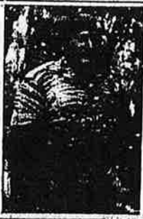
பாலியல்வாதிகள் டிராட்கிவியலாத சிந்தைத் தலைமையுடைய தலையிந்திர சிவாதிசா வெறிபெய்த சீர்ப்பாடித்து இராணுவத் தலைமையுடைய சீர்தந்தை புலிகள் இயக்கத்தை எடுக்க பாசில்டுவினின் அமைப்பாக சீர்தந்தை விட்டது.

இதில் வேடிக்கை என்னவென்றால் மொசைத் குழுமீடல் புலிகள் பதிந்திய பெற்ற அதே சீர்தந்தை சிங்கை படையினரும் பதிந்திய பெற்றது. "காள் சிவிட் தமம் மிகப் பெரியதாக இருந்ததால் அவர்கள் ஒருபடைகளை அடையாளம் காண முடியவில்லை. பின்னர் சிங்கைப் படையினர் வெறித்துக் கொண்டு சென்று பங்கா வராத எதிர்ப்புப் பதிந்திய அளித்தோம். அதே சீர்தந்தை புலிகளுக்கு அடிப்படையைக் குறிப்பிட்டு பதிந்திய உத்திகளை விளக்கிப் பதிந்திய அளித்தோம். இவ்வாறு ஒருவருக்கு தெரியாமல் மற்றவருக்குப் பதிந்திய அளித்தது. அரசியல் இடமேயேயே. இவர்களை உண்மைபெற்றிருக்கும் இவர்களுக்கு அனுப்ப வேண்டும்? இவர்கள் வந்தாணம் ஒன்றும் இவர்களை மொசைவின் அறிபாயமாகப் பெறும்