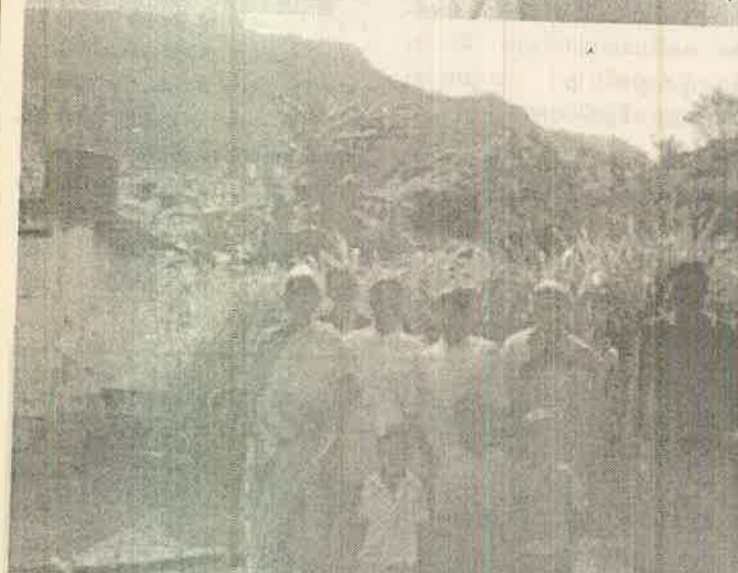
வறுமையினால் வாடும் பெண்களும் குழந்தைகளும்

இருக்கிறது. குறிப்பாக தோட்டத்துக்குள் இருக்கும், புல், பூண்டுகளை அழித்தல், தேயிலைச் செடிகளுக்கு உரம் இடுதல், கான் வெட்டுதல், ஆகியவை முற்றாக புறக்கணிக்கப்பட்டுள்ளது.