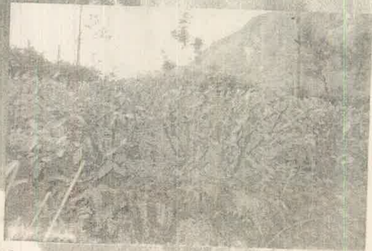
கவாத்து செய்யப்பட்ட தேயிலைச் செடிகள்

தில் வேலை குறைந்து விட்டது. தோட்ட நிர்வாகத்தின் அனுமதியுடன் யூலை 6-14 வரை தனியாரிடம் கொழும்பில் வேலை செய்தேன். நாளுக்கு 200 ரூபா வீதம், உணவு, தங்குமிடம் அனைத்தும் தரப்பட்டது. ஒரு நாள் சந்தேகம் எனக் கூறி பொலீசார் கைது செய்தனர். பின்னர் விடுதலை செய்தனர். எனது குடும்ப மொத்த வருமானம் 2000-2500 ரூபா