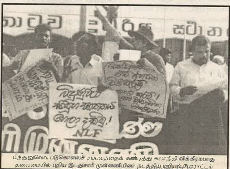
பிந்துனு வெவ படுகொலைச் சம்பவத்தைக் கண்டித்து கலாநிதி விக் கிரமபாகு தலைமையில் புதிய இடதுசாரி முன்னணியினர் நடத்திய மறுபுலி போராட்டம்

எனவே எதிர்காலத்தில் தென் இலங்கை முற்போக்கு சக்திகளை வலிமை பெறச் செய்வது, தமிழ் மக்களின் கரங்களிலேயே உள்ளது. அதைச் செய்வதன் மூலமே தமிழ் மக்கள் தமது விடுதலையைப் பெற முடியும்.