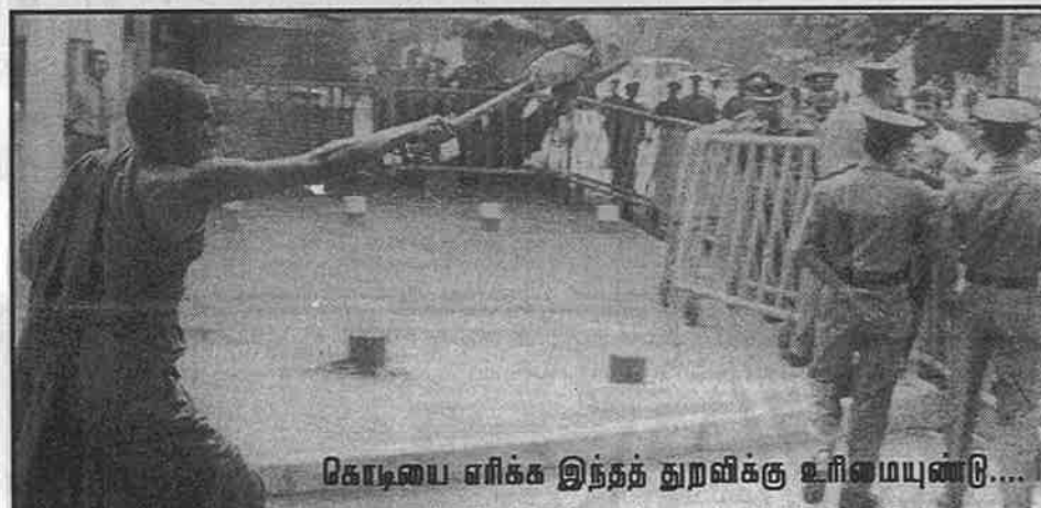
கொடியை எரிக்க இந்தத் துறவிக்கு உரிமையுண்டு... சொந்த வீட்டில் இருக்கவும் எமக்கு உரிமை இல்லை...

இன்று யுத்தத்திற்கு எவ்வளவுதூரம் அரசாங்கம் முக்கியத்துவம் கொடுக்கின்றதோ அவ்வளவு தூரம் இனவாதிகளின் செயற்பாட்டுக்கும் ஆதரவு கொடுக்கிறது. இனவாதிகளின் குரல் ஒங்கி ஒலிக்குமானால் இடைக்கால நிர்வாகம் என்ற நிலையும் கானல் நீராகலாம்.