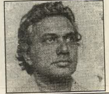
கலாரீதி விக்கிரமபாகு கருணாரத்தின

பின் நவீனத்துவத்தில் சாதகமாக நோக்கப்பட வேண்டிய கருத்துக்களும் உள்ளன. அதாவது சமூக பொருளாதாரத்துறைக்கு அப்பாற்பட்ட சாட்சியங்களை அது உள் கொண்டுள்ளது. அதேவேளை பொருளாதாரத் துறைகளையும், வர்க்க போராட்டத்தையும் உதாசீனம் செய்யும் பின்நவீனத்துவத்தின் போக்கானது, சந்தர்ப்ப வாத நிலைக்கு இட்டுச் செல்லும் நிலையை உருவாக்கும்.