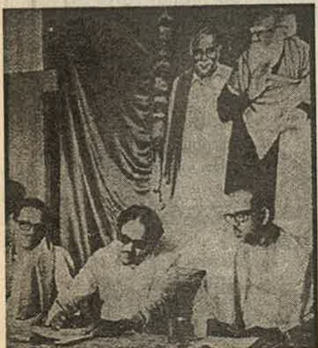
துளியுடன் வெளியேறினார் தி.மு.க. உருவானது.

1944, ஆகஸ்ட் 27ல் சேலத்தில் நடந்த நீதிக்கட்சி மாநாட்டில் நீதிக்கட்சியின் பெயர் ‘திராவிடர் கழகமாக’ மாறியது. “திராவிட நாடு திராவிடருக்கே” என்கிற முழக்கத்துடன் அண்ணாவால் துவக்கப்பட்ட பத்திரிகையின் பெயர் ‘திராவிட நாடு’ இந்தியா சுதந்திரம் அடைந்த போது அதை “துக்க நாள்” என்றார் பெரியார். திராவிடர் கழகத்திலிருந்த அண்ணாவோ வரவேற்றார். அரசியல் இயக்கமாகித் தேர்தலில் பங்கு பெற வேண்டும் என்கிற எண்ணத்தில் இருந்த அண்ணா, ‘பெரியார் - மணியம்மை’ திருமணத்தைக் காரணமாகாட்டி, திராவிடர் கழகத்திலிருந்து ‘கண்ணீர்த்