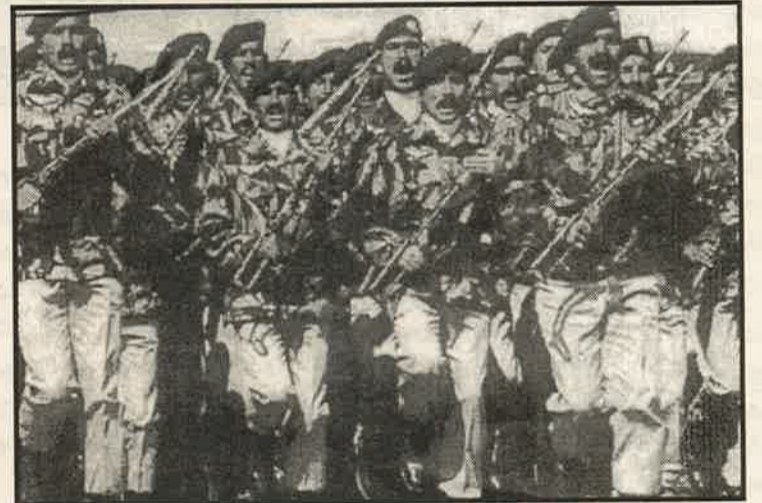
உண்மையில் இனப்பிரச்சினைக்கே, உரிய திட்டங்கள் எதுவும் இல்லாத நிலையில் பிரதான அரசியல் கட்சிகள் உள்ளன. இத்தகைய ஒரு சூழ்

இன்று வருமானத்தை அதிகம் கொடுக்கும் துறையாக இராணுவப்பகுதி இருப்பதால், கிராமிய மக்கள், நிலை சிக்கலானதாக உள்ளது. இனப்பிரச்சினை தீர்க்கப்பட்டு இராணுவ நடவடிக்கைகள், கட்டுப்பாட்டுக்குள் வருமாயின் கிராமியத்துறையில் வேலை வாய்ப்பு மற்றும் வருமானங்களில் பெரும் தாக்கம் ஏற்படும். இராணுவத்தில் இருப்பவர்களுக்கு ஏனைய துறையில் வேலை செய்வதற்கு நாட்டம் குறைவாகவே உள்ளது. இதற்கு முக்கிய