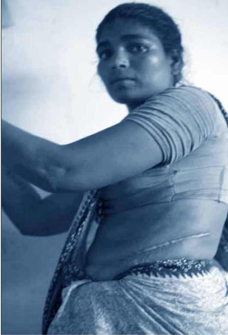
சென்னை 'கிட்னிவாக்கத்தை'ச் சேர்ந்த கலா!

பட்ட இரத்தத்தை உடம்பில் ஏற்ற பணம் இதர செலவுகளுடன் உங்களுக்கு கொடுக்க வேண்டும். தனியார் மருத்து ஏற்றப்பட்ட ரத்தத்திற்கு கட்டணம் வசூலிக்கும் வகையில் ஆபரேஷன் பில்லில் லிக்கப்பட்டிருக்கும். இரத்தம் தான