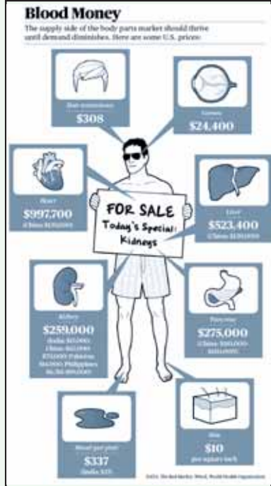
மனித உறுப்புகளின் அமெரிக்க விலை.

இது ஏதோ ஒரு நிறுவனம், ஒரு நபர் சார்ந்த திருட்டு நடவடிக்கை அல்ல. சில நேரங்களில் அந்த நிறுவனங்கள் அந்த நாட்டின் சுகாதாரத் துறையையே விலைக்கு வாங்கி விடுகின்றன. இந்தக் குற்றம் ஒரு குறிப்பிட்ட அமைச்சரின்