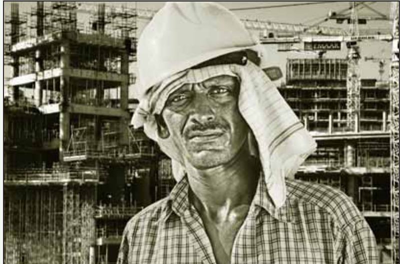
55 டிகிரி வெப்பத்தில் வேலை; குடியிருப்பது பாலைவனப் பொந்தில்; தொழிலாளியா - அடிமையா?

“கிளம்பமுடியாதே. அவர்களுடைய பாஸ்போர்ட்டை பிடுங்கி வைத்தி