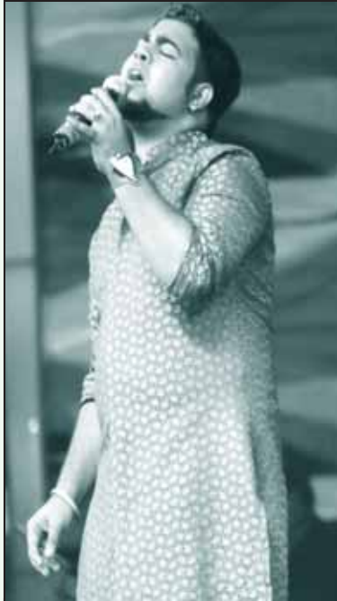
சந்தோஷ்: நோயற்ற இவரது தாயை வைத்து விஜய் டி.வி.யின் ஆபாச சென்டிமெண்ட்!

குழந்தைகளின் திறமையை அளக்கும் அளவுகோல் என்பது தற்போது ஆட்டமும், பாட்டமுமே. மகன்கள் தோல்வியடைந்தால் தாய்மார்கள் கண்ணீர் சிந்துகிறார்கள். மகள்கள் வெற்றி பெறவில்லையெனில் தந்தைகள் முன்குகிறார்கள். ஒருசில நிகழ்ச்சிகளில், “நல்லா பாடலைன்னா அப்பா அடிப்பார்” என்றே கூட குழந்தைகள் வெளிப்படையாகக் கதறி இருக்கின்றன.