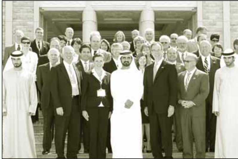
அமெரிக்க முதலாளிகளுடன் துபாயை ஆளும் ஷேக்குகள்! அடிமைகளை அழித்து எழுந்த அரசன்!!

அவள் சொல்லி முடிப்பதற்குள் ஓட்டலுக்குள் ஒரு புதிய வாடிக்கையாளர் நுழைகிறார். “ஐயா, இன்றிரவு உங்க