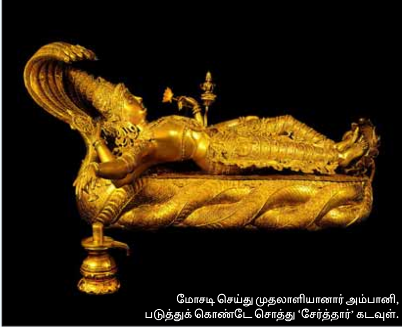
மோசடி செய்து முதலாளியானார் அம்பாணி, படுத்துக் கொண்டே சொத்து 'சேர்த்தார்' கடவுள்.

தான மன்னர்களுக்குப் பல்வேறு சலுகைகளை வழங்கி இந்திய யூனியனுடன் இணைத்த இரும்பு மனிதர் சர்தார்படேல், திருவிதாங்கூரை இந்தியாவுடன் இணைக்கும் ஒப்பந்தத்தில், பத்மநாபசாமி கோவில் திருவாங்கூர் மன்னர் சித்திரைத் திருநாள் பலராம வர்மாவின் நேரடி நிர்வாகத்தின் கீழ் இருக்கும் என்பதை ஏற்றுக் கொண்டிருந்தார்.