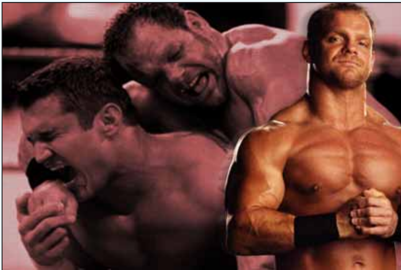
குடும்பத்தைக் கொலை செய்து தற்கொலை செய்து கொண்ட கிரிஸ் பென்னோயிட்.

சுமார் ஐந்தாயிரம் கோடிகளைக் குவிக்கும் இத்தொழிலில் விற்பனை செய்யப்படும் பண்டம் வெறித்தனமும், மிருகத்தனமும். அமெரிக்காவில் மட்டுமல்ல - அதை நுகர்வது உலகெங்கும் பரந்து விரிந்து கிடக்கும் இரசிகர் பட்டாளம் என்பது உங்களுக்கு வியப்பை ஏற்படுத்தலாம். ஆனால் அது தான் உண்மை. அமெரிக்காவின் மேலாதிக்க அரசியல் நலனுக்கேற்ற விதத்தில் இத்தகைய கேளிக்கைத் தொழில்கள் உலகெங்கும் தமது சாம்ராஜ்யத்தைக் கட்டியமைத்திருக்கின்றன.