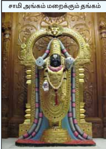
சாமி அங்கம் மறைக்கும் தங்கம்

இதுதான் ‘இந்துப் பொக்கிஷத்தை’ச் சுருட்டிக் கொண்டு போவதற்கு ‘இந்து மன்னன்’ செய்த சதியின் கதை. சமஸ்