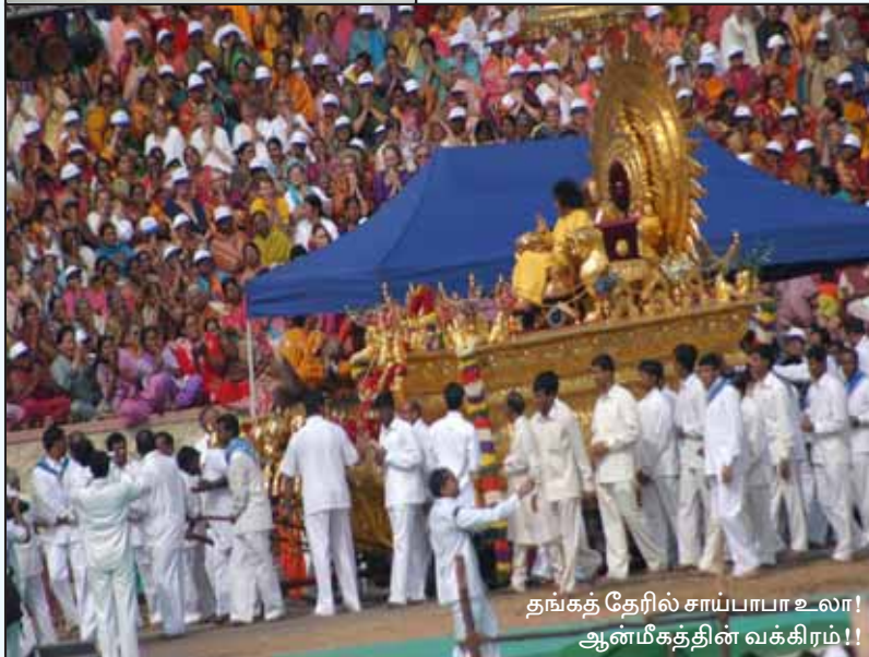
தங்கத் தேரில் சாய்பாபா உலா! ஆன்மீகத்தின் வக்கிரம்!!