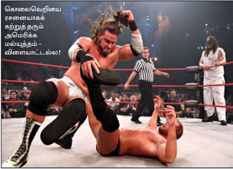
கொலைவெறியை ரசனையாகக் கற்றுத் தரும் அமெரிக்க மல்யுத்தம் - விளையாட்டல்ல!

கூட சம்பளம் கொடுத்துப் பராமரிக்கின்றன. உதாரணமாக, எதார்த்த உலகில் அமெரிக்கா ஆக்கிரமிப்புப் போர் தொடுக்கும் நாடுகளைச் சேர்ந்தவர்கள் போல் சித்தரிக்கப்படும் மல்யுத்த வீரர்கள் வில்லன்களாகவும், அமெரிக்க வீரர்கள் நல்லவர்கள் போலவும் சித்தரிக்கப்படுகிறார்கள்.