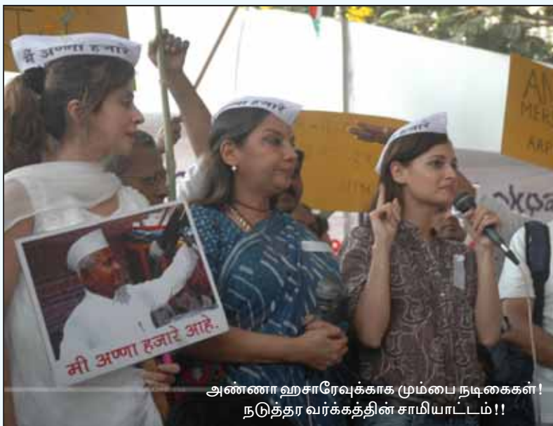
அண்ணா ஹசாரேவுக்காக மும்பை நடிகைகள்! நடுத்தர வர்க்கத்தின் சாமியாட்டம்!!

இதோ மும்பையின் இரண்டாவது பெரிய சேரிப்பகுதியிலிருந்து உழைக்கும் மக்களை பலர்த்காரமாய் விரட்டியடித்து விட்டு அந்நிலத்தைப் பிடுங்கியில் எஸ்டேட் முதலைகளின் கைகளில் ஒப்படைக்க மகாராஷ்டிர அரசு எடுத்து வரும் நடவடிக்கைகளை அம்மக்கள் எதிர்த்து நிற்கிறார்கள். ஜெய்தாபூரின் அணுமின் நிலையத்தை எதிர்த்துப் போராடும் மக்களுடன் துப்பாக்கி