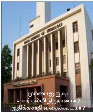
மும்பை ஐ.ஐ.டி.: உயர் கல்வி நிறுவனமா? ஆதிக்க சாதி வதைக்கூடமா?