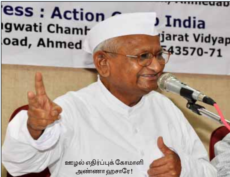
ஊழல் எதிர்ப்புக் கோமானி அண்ணா ஹசாரே!

உடனே இதுதான் ஊழலுக்கு எதிரான இறுதி யுத்தம் என்று ஊடகங்கள் போர்க்குரல் எழுப்பத் துவங்கின. இந்த யுத்தத்தில் மட்டும் எப்படியாவது வென்று விட்டால் இந்தியா வல்லரசு வதை யார் நினைத்தாலும் தடுக்க முடியாது என்று சொல்ல ஆரம்பித்தன. திசை தெரியாத இருளின் நிசப்தத்தில் ஆழ்ந்து கிடக்கும் ஒரு சமூகத்தில் இந்த உண்ணாவிரதம் ஒரு விடிவெள்ளியென்றும், மக்களுக்கான விடிவு இந்தப் போராட்டங்களில் பங்குகொள்வது மட்டும் தான் என்றும் சினிமா நடிகர்களும், பிற மேட்டுக்குடிப் பிரபலங்களும், சீமாள்களும், சீமாட்டிகளும் தொலைக்காட்சித் திரையில் தோன்றி ஓயாமல் ஓதினர்.