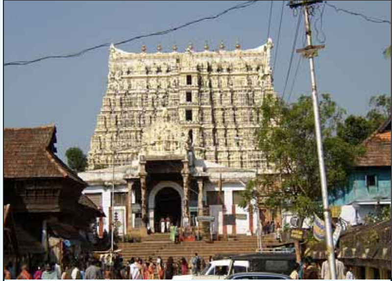
உழைக்கும் மக்களின் உதிரத்தை பொக்கிஷமாய் மாற்றி பதுக்கப்பட்ட திருவனந்தபுரம் பத்மநாபசாமி கோவில்.