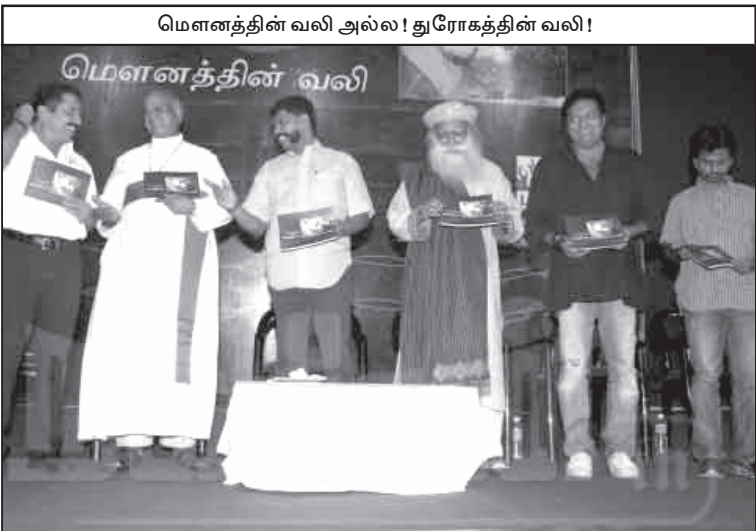
மெளனத்தின் வலி அல்ல! துரோகத்தின் வலி!

புலி ஆதரவாளர்களின் மனோநிலை கொஞ்சம் விசித்திரமானதுதான். ‘ஏசு கிறிஸ்து வின் கடைசி ஆசை’ என்ற திரைப்படத்தில் வரும் ஒரு காட்சியை அது நினைவூட்டுகின்றது. சிலுவையில் அறையப்பட்டு அரையாய்க் நிலையில் கனவு காணும் ஏசு, தான் சிலுவையிலிருந்து தப்பி காதலியை மணந்து குடும்பம்