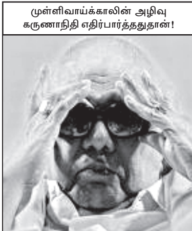
முள்ளிவாய்க்காலின் அழிவு கருணாநிதி எதிர்பார்த்ததுதான்!

குண்டு வீச்சின் இரைச்சலுக்கும், மக் களின் ஓலத்துக்கும் இடையே, ரத்தமும்