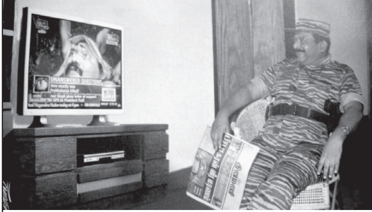
நக்கீரன் அட்டை - பொய்யென்று தெரிந்தாலும் அதையே புலி ஆதரவாளர்கள் நம்ப விரும்பினார்கள்.