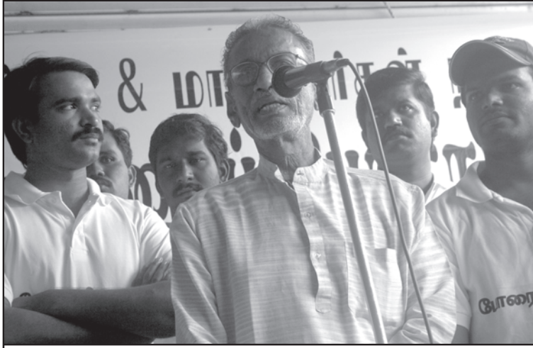
முள்ளிவாய்க்கால் படுகொலை: இரத்தத்தில் 'கை கழுவிவர்கள்'!

இந்தக் கேள்விகள் எதையும் புலி ஆதரவாளர்கள் இவர்களைக் கேட்க