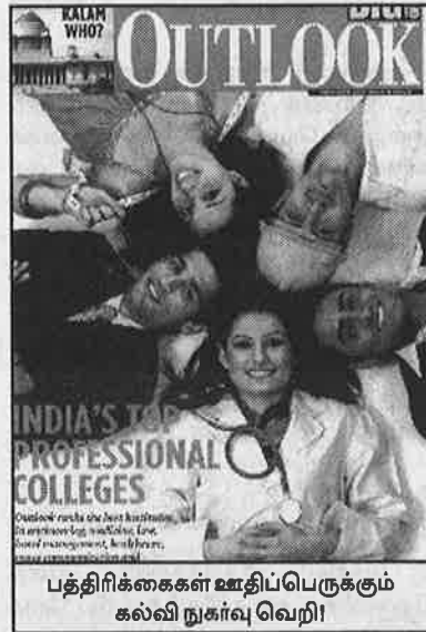
பத்திரிக்கைகள் ஊதிப்பெருக்கும் கல்வி நுகர்வு வெறி!

தகவல் தொழில் நுட்ப வேலை வாய்ப்பை வாங்க உதவும் பொறியியல் கல்வியில், ஒவ்வொரு ஆண்டும் 7 இலட்சம் மாணவர்கள் சேருகின்றனர். இதில் தமிழகத்தில் மட்டும் விரல் விட்டு எண்ணத்தக்க அளவு அரசுக் கல்லூரிகளோடு சேர்த்து, 262 பொறியியல் கல்லூரிகள் இயங்குகின்றன. இவ்வாண்டு பொறியியல் கலந்தாய்வின் மூலம், அரசு நிர்ப்புள்ள இடங்களின் மொத்த எண்ணிக்கை 62,337. இவற்றில், சுயநிதிக் கல்லூரிகளில், ஒரு மாணவனுக்கான கல்விக் கட்டணம் ரூ.30,000/-ஆக நிர்ணயிக்கப்பட்டுள்ளது. இவை தவிர, 37,838 இடங்கள் கல்லூரிகளின் நிர்வாக ஒதுக்கீட்டின் கீழ் வருகின்றன. இவற்றுக்கான கட்டணம் சாராயக் கடை ஏலத்தைப் போல பல லட்சங்களில் கல்வி வள்ளல்களால்தான் தீர்மானிக்கப்படுகிறது.