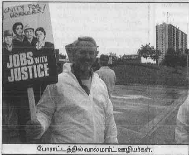
போராட்டத்தில் வால்மார்ட் ஊழியர்கள்.

அதேபோல பிரொக்டர் அண்ட் கம்பிள் (விக்கல் கம்பெனி), வீலவல் (ஜீன்ஸ் கம்பெனி), ரெவ்லான் (அழகு சாதனங்கள்) போன்ற பல முன்னணி அமெரிக்க நிறுவனங்கள் தமது