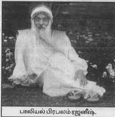
பாலியல் பிரபலம் ரஜனீஷ்.

அறிவுத் திறன் வகுப்புக்கள் முதலான வற்றைக் கலந்து ஒரு புதிய கட்டமைப்பில் பன்னாட்டு நிறுவனங்கள் விளம்பரப்படுத்தும் புதிய சோப்புக் கட்டி போல அறிமுகப்படுத்தி வெற்றி பெற்றார். இவரது குருவான மரித்துப் போன மகேஷ் யோகி மேலை நாடுகளில் மணிக்கு சில ஆயிரங்கள் டாலர் கட்டணத்தில் ஆழ்நிலை தியானத்தைக் கற்றுக்கொடுத்து பிரபலமானார். இதே சரக்கை ஹாலிவுட் நட்சத்திரங்கள் மற்றும் பன்னாட்டு நிறுவன நிர்வாகிகளுக்கு ஏற்ப விற்று, அவர்கள் மூலம் புகழ் பெற்றார் தீபக் தாக்கூர்.