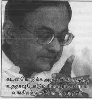
கடன்கொடுக்க அரசுவாய்க்களுக்கு உத்தரவு போடும் பித்தாரம் தனியார் வங்கிகளுக்கு போடாதது ஏன்?

இந்த ஆண்டும் கவுன்சலிங்கில் நிகழ்ந்த குரூபடிகள், செட்டிநாடு மருத்துவக் கல்லூரி ஒரு சீட்டிற்கு 14