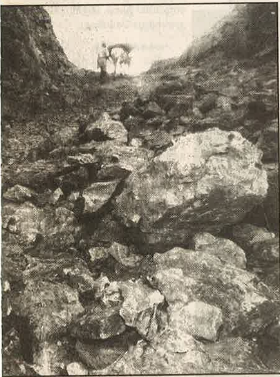
து ஏற்படுத்திய பாதையில் தசரத் மான்ஜி.

அதே நேரத்தில் 22 ஆண்டுகள் ஒரு மலையோடு தன்னந்தனியனாக ஒரு மனிதன் மோதிக்கொண்டிருக்க, அதனை வேடிக்கை பார்த்துக் கொண்டிருந்த இந்தச் சமூகத்தின் பாறைப் விஞ்சும் ‘மன உறுதி’க்கும் இதுதான் நினைவுச்சின்னம்.