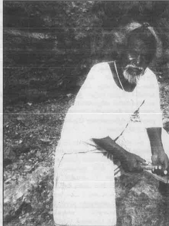
22 ஆண்டு உழைப்பில் மலையை உடை...

தனி ஒருவனாக நின்று இத்தகைய சாதனையை நிகழ்த்திய வீரனை மனித குல வரலாறு இதுவரை கண்டதில்லை. "மலையை உடைக்கப் போகிறேன்" என்று கையில் உளியையும் சுத்தியலையும் எடுத்த தசரத்தை 'வரலாறு படைக்க வந்த மாவீரன்' என்று மக்கள் கொண்டாடவில்லை. 'பைத்தியம்'