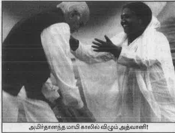
அமிர்தானந்த மாயி காலில் விழும் அத்வானி!

மனதிற்கு அப்படிச் சிறப்பாகப் பயிற்சியையும், ஓய்வையும் தந்திருப்பவர்களுக்குக் கூட வாழ்க்கைப் பிரச்சினைகளால் மனது பாதிக்கப்படுவது