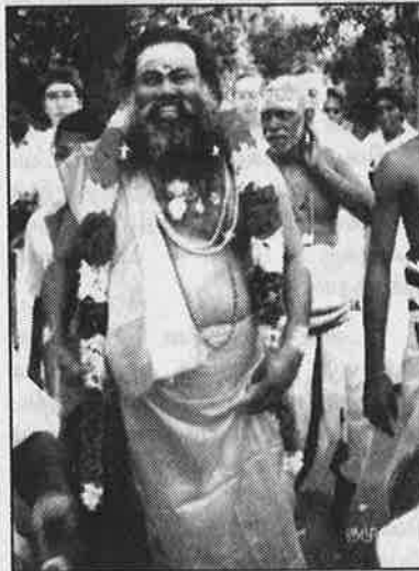
14 கற்பழிப்பு 1 கொலைக்காசு 2 ஆயுள் தண்டனை பெற்ற பிரேமானந்தாவுக்கு இன்னும் வெளிநாடுகளில் ஆசிரமங்கள் உள்ளதாம்!

ஐ.ஐ.டி. ஐ.ஐ.எம், ஐ.ஏ.எஸ், மருத்துவ-பொறியியல் படிப்புகள் அரசு பதவிகள், வங்கி வேலைகள், தனியார் நிறுவன உயர் பதவிகள், அதிவருவாய் கிடைக்கும் கணினித் துறையின் முக்கியப் பதவிகள் முதலாம்