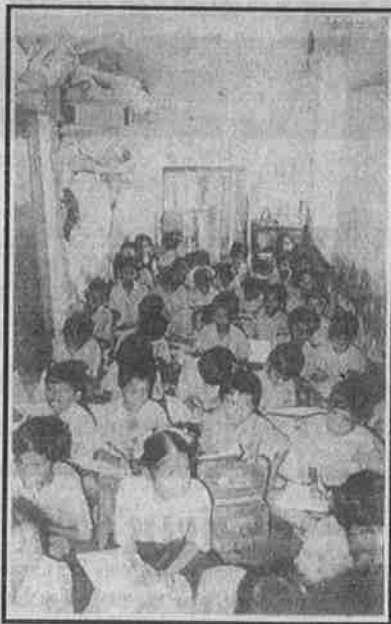
சரிந்து விழும் ஆரம்பக் கல்வி ஒட்டைக் கூரை; இட நெரிசல்; புறக்கணிக்கும் அரசாங்கம்.