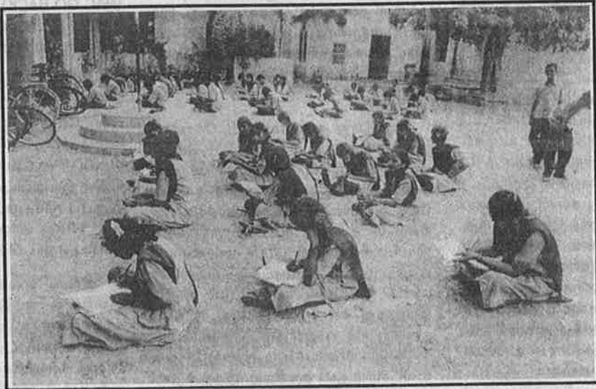
மைதானமே தேர்வு அறையாக “வெயில் வானம் மேலே சுருமணல் கீழே”

சோமாலியா அனுபவம் நமக்குப் பாடம். 80களில் எத்தியோப்பியாவுடன் நடந்த போருக்குப்பின் ஏற்பட்ட பொருளாதார நெருக்கடியால் உலகவங்கி மற்றும் ஐ.எம்.எஃப்.-இன் நிபந்தனைகளையெல்லாம் ஏற்றுக் கட்டுமானச் சீரமைப்பைச் சோமாலியா மேற்கொண்டது. ஒவ்வொரு சோமாலியன் தலைமீதும் 281 டாலர்கள் கடன் சுமை விழுந்தது.