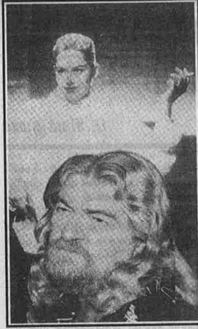
புகை புற்று நோயைத் தரும்; ஹாலிவுட் செக்ஸ் வக்கிரமோ உள்ளத்தை ரணமாக்கி விடும். (படத்தில்: நடிகை ஷாரன் ஸ்டோனும், திரைக்கதையாளர் ஜோ எஸ்தராலும்).

இப்படி உலகெங்கும் ஹாலிவுட் பாணி செக்ஸ் கல்வி காசுபார்ப்பதோடு, நோயும் பரப்புகிறது. இதெல்லாம் ஹாலிவுட்டின் மனிதநேயப் போராளிகளுக்குத் தெரியாமல் போனது ஏன்? ஏனெனில் புகைப்பழக்கம் நேரடியாக நுரையீரலைப் பாதித்து புற்றுநோயைத் தருகிறது. செக்ஸ் வக்கிரமோ நேரடியாக உடலைப் பாதிப்பதில்லை; உள்ளத்திற்கு மகிழ்ச்சி