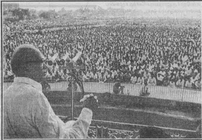
பீகார் இயக்கத்தின் நோக்கமும், ஆர்.எஸ்.எஸ்.இன் நோக்கமும் ஒன்றுதான் என்று சான்றிதழ் அளித்த ஜெயப்பிரகாஷ் நாராயண், பாட்னாவில் பேசுகிறார்.

இந்திராவின் வாயால் பாசிச சக்திகள் என்று கூறப்பட்ட காரணத்தினாலேயே ஜனசங்கம் ஜனநாயக ஒளியைப் பெற்றது போல, பிழைப்புவாதிகளின் வாயால் உச்சரிக்கப்பட்ட காரணத்தினாலேயே மதச்சார்பின்மை என்ற சொல் மதிப்பிழந்தது.