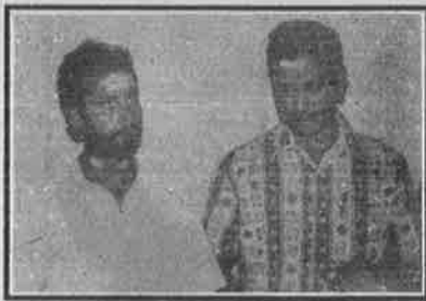
கோபுரத்திலிருந்து தற்கொலை செய்வதாக எச்சரித்த சிவனடியார்கள்.

இத்தனைக்குப் பிறகும், காஞ்சி ஒடுகாலி தனது சாக்கடை மொழியால் தமிழர்கள் அனைவருக்கும் எதிரான அவதூறுகளையும், பொய்களையும் அவிழ்த்து விட்டுள்ளார்: "சைவத்திலே