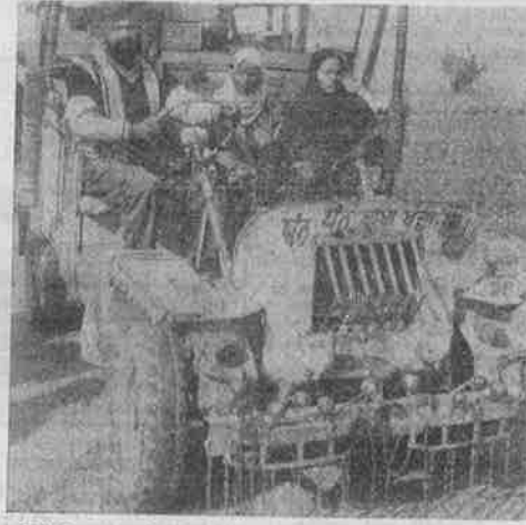
இந்திய - பாக் எல்லைக் கிராமமொன்றிலிருந்து வெளியேறும் ஒரு குடும்பம்

மக்கள் விரோத தாராளமயக் கொள்கைகள் அனைத்தும் இதே போன்ற சர்வகட்சி ஒற்றுமையுடன்தான் பாராளுமன்றத்தில் நிறைவேற்றம் பட்டிருக்கின்றன. எனவே மக்களின் ஜனநாயக உரிமைகள் மீது தாக்குதல் நடத்தும் எதிரிகளின் கோட்டை