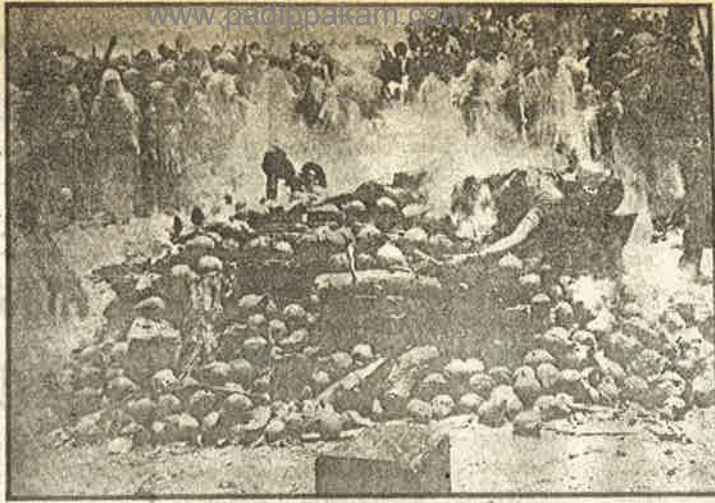
ரூப் கன்வர் உடன்கட்டை ஏற்றிக் கொல்லப்பட்டதை பதிவு செய்த குறும்படம் இந்துமதவெறியரால் தடை செய்யப்பட்டது.

இந்தியாவின் திரையுலகமும் கூட பார்ப்பனியத்தின் பண்பாட்டு விழுமியங்களை ஏற்றுக் கொண்ட உறுதுருமுலாகத்தான் இருக்கின்றது. இந்தத் திரையுலகைக் கட்டுப்படுத்துவது பால்தாக்கரேவின் சிவசேனா கும்பல்தான். ரோஜாப் படத்தில் காசமீர் முசலீம் மக்களைக் கேவலப்படுத்திய மணிரத்தினம், 'பம்பாய்' படத்திலும் முசலீம்களைக் கலவரக்காரர்களாக உண்மைக்குப் புறம்பாகச் சித்திரித்ததனாலேயே தாக்கரேயின் பாராட்டையும், அனுமதியையும் பெற்றார். மணிரத்தினத்தின் இத்தகைய படங்கள் தூர்தர்சனின் ஏதோ ஒரு அலைவரிசையால் மாதந்தோறும் இப்போதும் திரையிடப்படுகிறது. பாகிஸ்தான் எதிர்ப்பை வைத்து முசலீம்களை பயங்கரவாதிகளாக - வில்லன்களாகக் காட்டும் படங்கள் தற்போது ஏராளம் வருகின்றன. முசலீம்களையும், கம்யூனிஸ்டுகளையும் கேவலப்படுத்தி ஹாலிவுட்டில் 80-களில் வந்த படங்களின் போக்கிற்கு இணையானது இது.