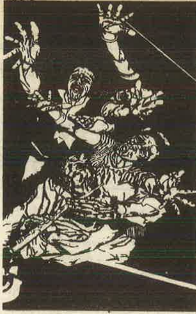
தென்னாப்பிரிக்க ஒலிபம்

பிறப்பாலும் தொழிலாலும் பாகுபடுத்தி ஒடுக்கப்படும் தாழ்த்தப்பட்ட மக்கள், தீண்டாமைக் கொடுமையால் பலவகையிலும் வாழ்வுரிமை மறுக்கப்படும் மக்கள், மரபு மற்றும் மத அடிப்படையில் பொது மதவழிபாடு, பொதுக் குடிநீர் நிலைகள், பொதுப் பாதை முதல் கடுகாடு - இடுகாடு வரை பொது இடங்களைப் பயன்படுத்துவதிலிருந்து, வன்முறையாகத் தடுக்கப்படும் மக்கள், நாள்தோறும்