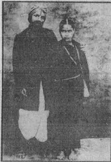
அன்றைய பாரதி - செல்லம்மா

இந்து தேசியத்தைக் கனவு காணும் வாய்ப்புப் பெற்ற பார்ப்பனச் சாதியில் பிறந்த, சமஸ்கிருதக் கல்வி கற்ற பாரதி, ஆங்கிலக் கல்விக்கும் ஷெல்லி, விட்மன் போன்ற ஆங்கிலக் கவிஞர்களின் கவிதைகளுக்கும் அறிமுகமாகின்றான். காலனியாதிக்க எதிர்ப்பென்பது கருத்தளவில் மட்டுமின்றி, வெள்ளையனால் ஏமாறப்பட்ட தந்தையின் மரணம் எனும் சொந்த அனுபவத்தினூடாகவும், நாம் இன்ன தென்று அறியாத பிற காரணிகளாலும்