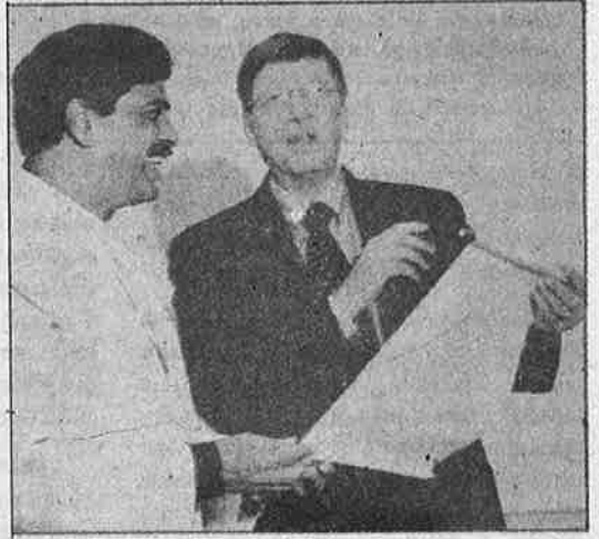
மைக்ரோ சாப்டின் உலக ஏகபோகத்திற்கு ஒத்து ஊதும் பா.ஜ.க. அரசின் அமைச்சர் பிரமோத் மகாஜன் - பில் கேட்சுடன்.

அமெரிக்க ஐரோப்பிய தொழிலாளர்கள் மீது அக்கறை இல்லை என்பது