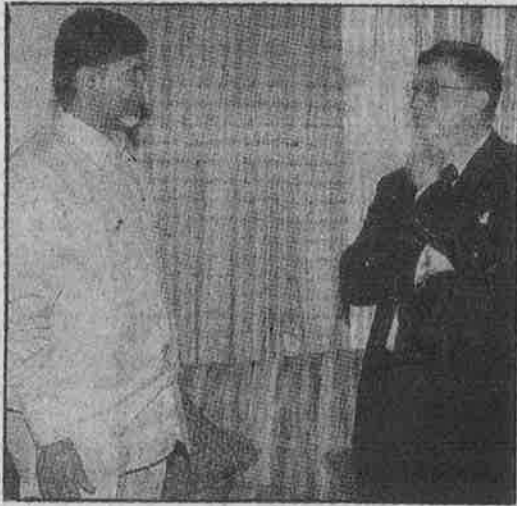
“மின்சாரக் கட்டண உயர்வு, விவசாயத்திற்கு மானியம் ரத்து, கணினி நிறுவனங்களுக்கு எல்லாச் சலுகையும் உண்டு” ஆண்டையிடம் பட்டியலிடும் அடிமை சந்திரபாபு நாபுடு.

இறக்குமதி செய்தால்தான் தங்களை அமெரிக்காவுக்கு ஏற்றுமதி செய்து கொள்ள முடியும் என்பதால் இவர்கள் உலகமயமாக்கத்தை ஆதரிக்கிறார்கள்.