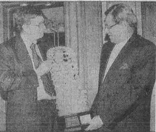
“நாபுடுவைப் போல நானும் நல்ல அடிமை தான்” ஆண்டையின் திருப்பார்வைக்கு ஏங்கி நிற்கும் கர்நாடக முதல்வர் கிருஷ்ணா.

செல்லவையில் பாஸ்ட் புட் கடைகளில் சிறுண்டியைச் சுவைத்தபடியே கோக் பருகிக் கொண்டிருக்கும் இவர்களிடம் பருத்தி விவசாயிகள் பூச்சி மருந்து குடித்துச் சாவதைச் சொல்லுங்கள். ஏதோ மாயாஜாலக் கதையைக் கேட்பது போன்ற வியப்புடனும், கொஞ்சம் அனுதாபம் கலந்த விழிகளுடனும் அதைக் கேட்பார்கள். பின்னர் “அதற்கு நான் என்ன