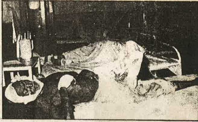
'உருது' மொழிக்கெதிராய், உ.பி. மாநிலம் பதுவானில் - ஆர்.எஸ்.எஸ்.இன் கலவரம்.

இருப்பினும் வாழ்வின் பல தளங்களிலும் ஊடுருவிவிட்ட இந்து மதவெறி உருதுவைப் புறந்தள்ளியதில் வெற்றி பெற்றுவிட்டது. மும்மொழித் திட்டத்தை அமல்படுத்தச் சொன்னபோது வட மாநில முதலமைச்சர்கள் உருதுவை ஏற்கவில்லை. எட்டாவது அட்டவணியில்