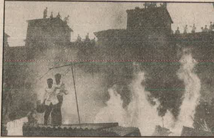
பெரும்பாலான குடிசைப் பகுதி சிவசேனா குண்டர்களால் தீ வைக்கப்பட்டுக்கிறது

யையும், தஞ்சமடைந்திருந்த அப்பாவி முஸ்லீம்களையும் வேட்டையாடிய சிவசேனா இந்துக்களின் கொலைவெறி? அந்த உண்மைச் செய்தியை பழையபேப்பர் கடையில்தான் தேடிப்பார்க்க வேண்டும்.