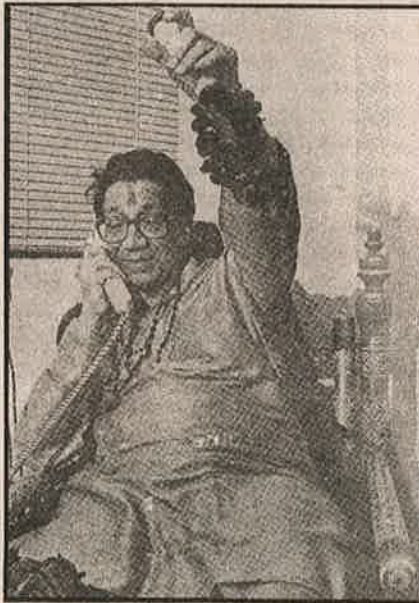
மணிரத்தினத்தின் 'பம்பாய்' மிகச் சிறந்த படம். நான் படத்தைப் பார்த்தேன் சில மாற்றங்கள் மட்டும் செய்யச் சொன்னேன் அவ்வளவுதான். பம்பாய் கலவரத்துக்காக நான் வருந்துவது போல ஒரு காட்சி வருகிறது. அது உண்மையல்ல; நான் எதற்காகவும் வருந்தவில்லை. பால தாக்கரே