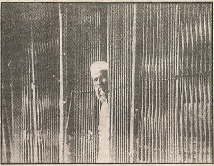
பம்பாய் ஊடக ரூட்டம் முசுலீம் பகுதியில்தான். ஊடக ரூட்டது விட்டது என்று எட்டிப் பார்ப்பும் ஒரு முதியவர்.

ராஜீவ் கொலையை மையமாகக் கொண்டு தயாரிக்கப்பட்டிருக்கும் 'குற