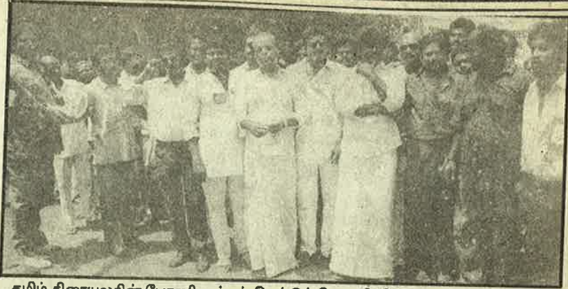
தமிழ் திரையுலகின் பேரணி: மக்கள் கெட்டுப் போக சினிமா காரணமில்லையாம்!

வழக்கமாக மாமூல் வாங்கிக் கொண்டு திடீரென்று கணக்கு காட்டுவ தற்காகப் பிடித்துக் கொண்டு போகும் போலீசை அசிங்கம், அசிங்கமாக நடுவீதியில் கேள்வி கேட்கும் சாராய வியாபாரியைப் போல கோடம்பாக்கம் சினிமா இப்போது கேட்கிறது. இருந்தாலும் இந்தக் கேள்விக்கு தணிக்கை பதில் சொல்லியே தீர வேண்டும். பழைய சட்டப் படியே "இந்து" என்ற ஆபாசப்படம் (தணிக்கைக் குழுவில் உள்ள பெண் உறுப்பினர் இல்லாத நேரம் பார்த்து) அனுமதிக்கப்பட்டது எப்படி? மூட நம்பிக்கைகளைத் தடுத்து விஞ்ஞான சிந்த